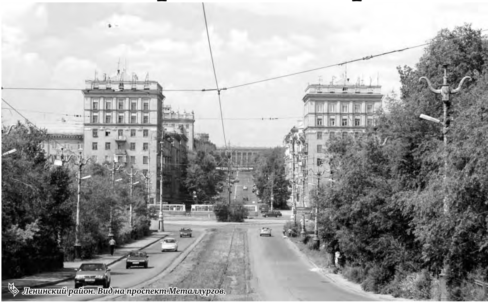
Ленинский район. Вид на проспект Металлургов.