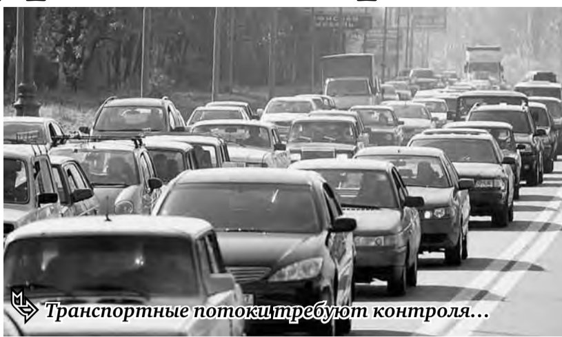
Транспортные потоки требуют контроля...

Одним из элементов интеллектуального комплекса является система видеонаблюдения и видеодетектирования. Она обеспечивает не только сбор информации о транспортных