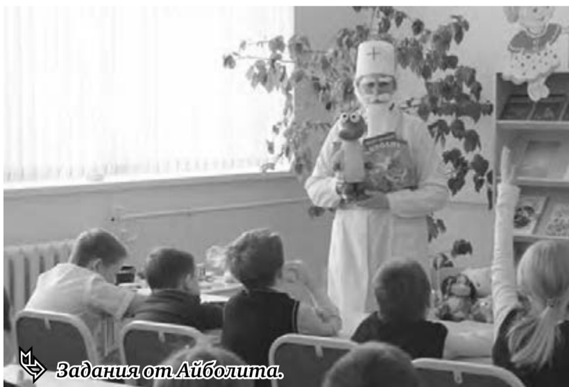
Задания от Айболита.

Михалкову – 99! Специально к этой предъюбилейной дате сотрудники библиотеки подготовили и провели масштабное мероприятие – экскурсию «Добро пожаловать к Михалкову». Именно этими словами под звуки фанфар хозяйка библиотеки встречала своих маленьких гостей. Юным читателям представилась еще одна отличная возможность посетить теперь уже именную библиотеку и открытый в ней музей С.В. Михалкова, познакомиться с редкими раритетными изданиями книг писателя, сфотографироваться на память с дядей Степой, словно сошедшим с книжной страницы, а также своими глазами увидеть заветную подпись,