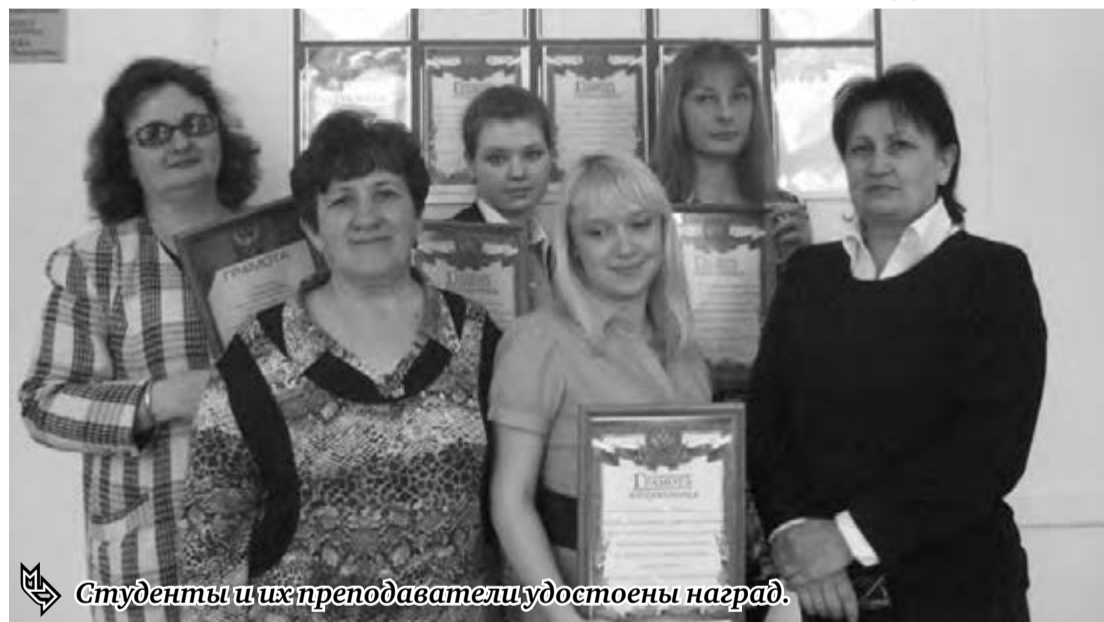
Студенты и их преподаватели удостоены наград.

– Работа над проектами вызвала у наших студентов некоторые трудности, так как интегрированный метод обучения для дошкольных учреждений является инновационным, – рассказывает