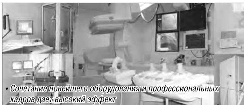
• Сочетание новейшего оборудования и профессиональных кадров дает высокий эффект