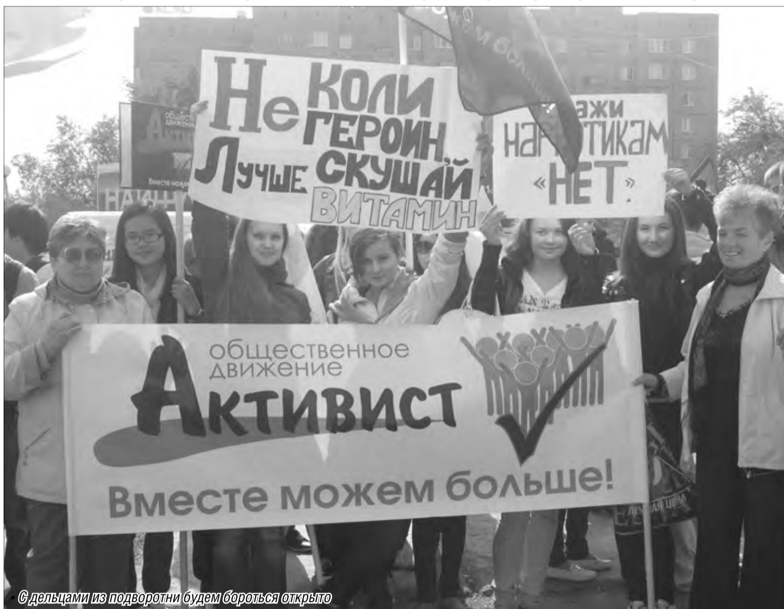
© Дельцами из подворотни будем бороться открыто

В минувшую субботу магнитогорцы собрались на митинг в поддержку идеи консолидированной борьбы общества против распространения наркотиков