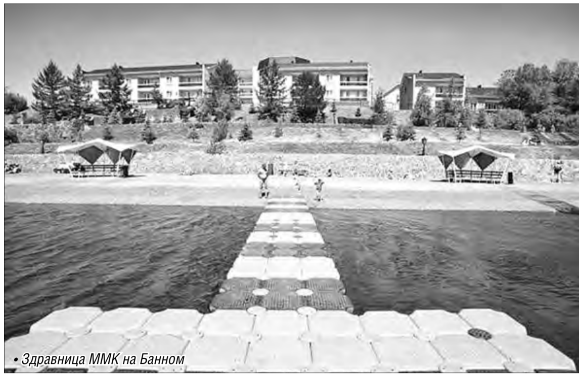
• Здравница ММК на Банном

Еще одно направление охраны здоровья работников ММК – реализация медицинских программ, в рамках которых в первом полугодии металлурги получали лечебные и оздоровительные услуги по