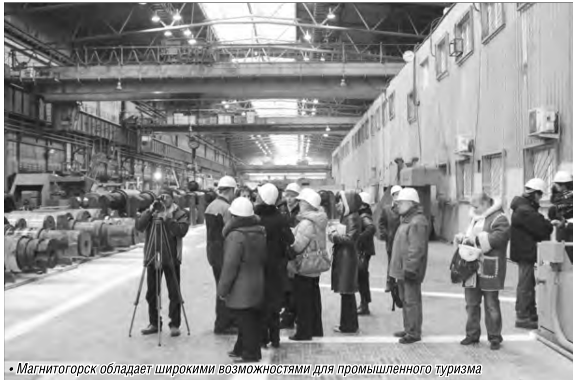
• Магнитогорск обладает широкими возможностями для промышленного туризма