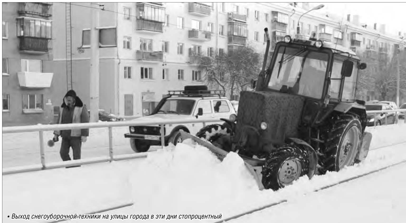
• Выход снегоуборочной техники на улицы города в эти дни стопроцентный

За выходные и понедельник в городе выпала почти месячная норма осадков