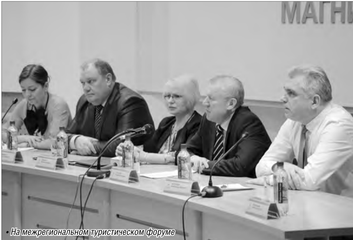
• На межрегиональном туристическом форуме

Прекрасный способ провести отпуск – всей семьей по «Золотому кольцу» или на Саянах, а то и проще – по родному Уралу. Только жаль, говорим мы об этом в прошедшем времени.