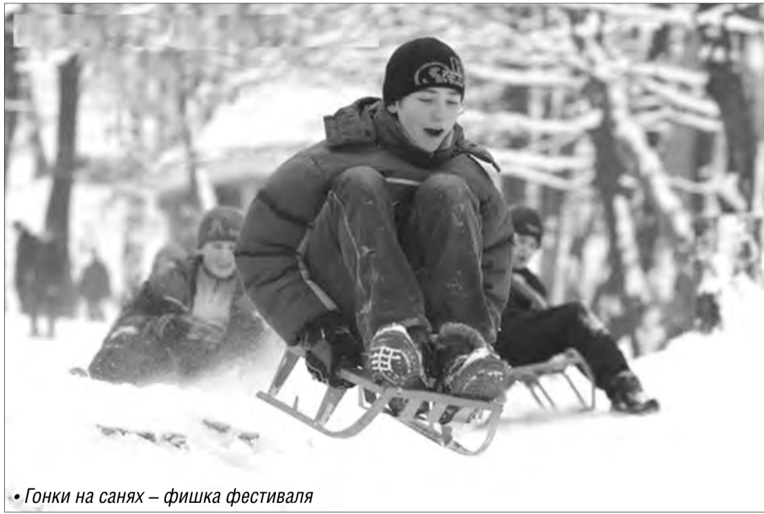
• Гонки на санях – фишка фестиваля

Организаторы обещают: фестиваль «SUNKI//Зима-2012» станет самым незабываемым событием уходящего года на Урале