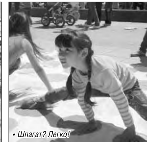
• Шпагат? Легко!

В большой лодке малыши, словно воробышки, расселись по бортам и отправились в кругосветное путешествие. Это клуб детского и юношеского туризма пропаган-