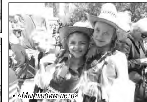
• «Мы любим лето»