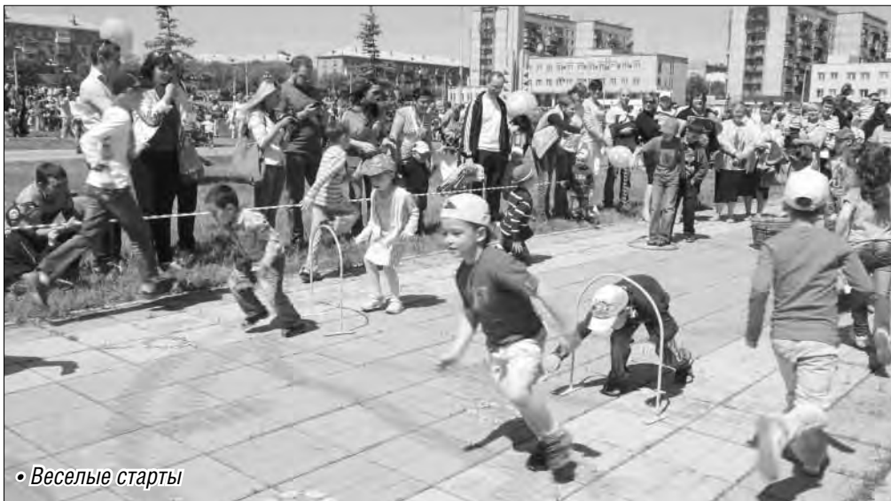
• Веселые старты