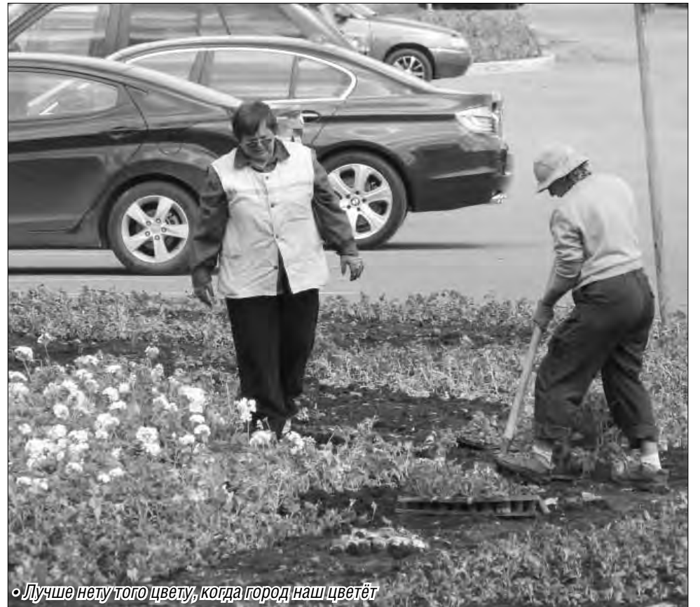
«Лучше нету того цветку, когда город наш цветёт»

Напомним, что административные комиссии призваны действенно и оперативно реагировать на нарушения в сферах благоустройства и озеленения, застройки, транспортного обслуживания населения. Ко-