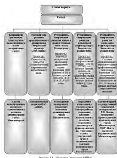
Рисунг 3.1 – Структура управления КПМом.

ванных в реализации КПМ: администрация города, руководство градообразующего предприятия, малый и средний бизнес, население в лице общественных организаций, инвесторы. Различные мероприятия, предусмотренные КПМом, могут затрагивать интересы нескольких субъектов. Действия одного субъекта могут быть выгодны или невыгодны для других субъектов. Поэтому управление реализацией КПМ целесообразно вести с участием всех заинтересованных субъектов. Процесс управления КПМом представляет собой обеспечение своевременности и результативности мероприятий, по которым ключевой субъект является ответственным; обеспечение достоверной информации для других субъектов. Поэтому управление реализацией КПМ целесообразно вести с участием всех заинтересованных субъектов, а также контроль исполнения проектов по срокам и стоимости, своевременное реагирование на незапланированные изменения и оперативное их решение.