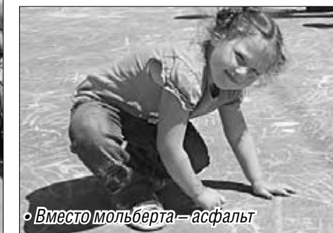
• Вместо мольберта – асфальт

дирует путешествия по реке и романтическую жизнь в палатках.