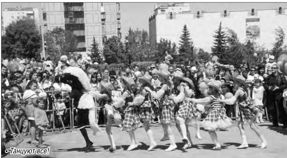
• Танцуют все!

1 июня на площади возле курантов праздник, посвященный Дню защиты детей, официально открыл лето.