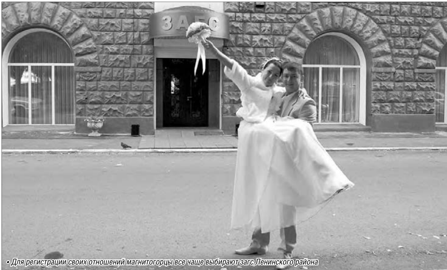
• Для регистрации своих отношений магнитогорцы все чаще выбирают загс Ленинского района

Ленинский и городской загсы Магнитогорска названы лучшими в области по благоустройству территории