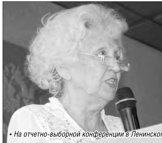
На отчетно-выборной конференции в Ленинском районе

Одна за другой в трех районах города состоялись отчетно-выборные конференции ветеранских советов