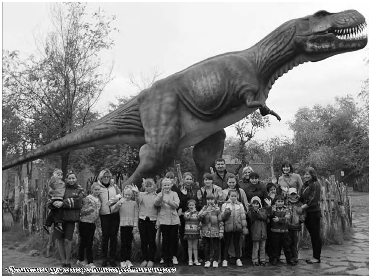
• Путешествие в другую эпоху запомнится ребятишкам надолго

Ребята из детского дома Верхнеуральского района побывали в динопарке