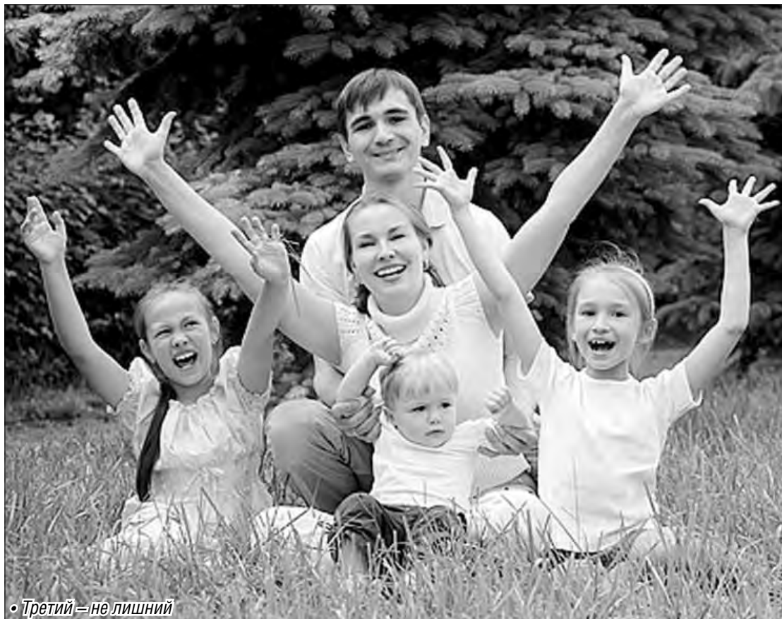
• Третий – не лишний