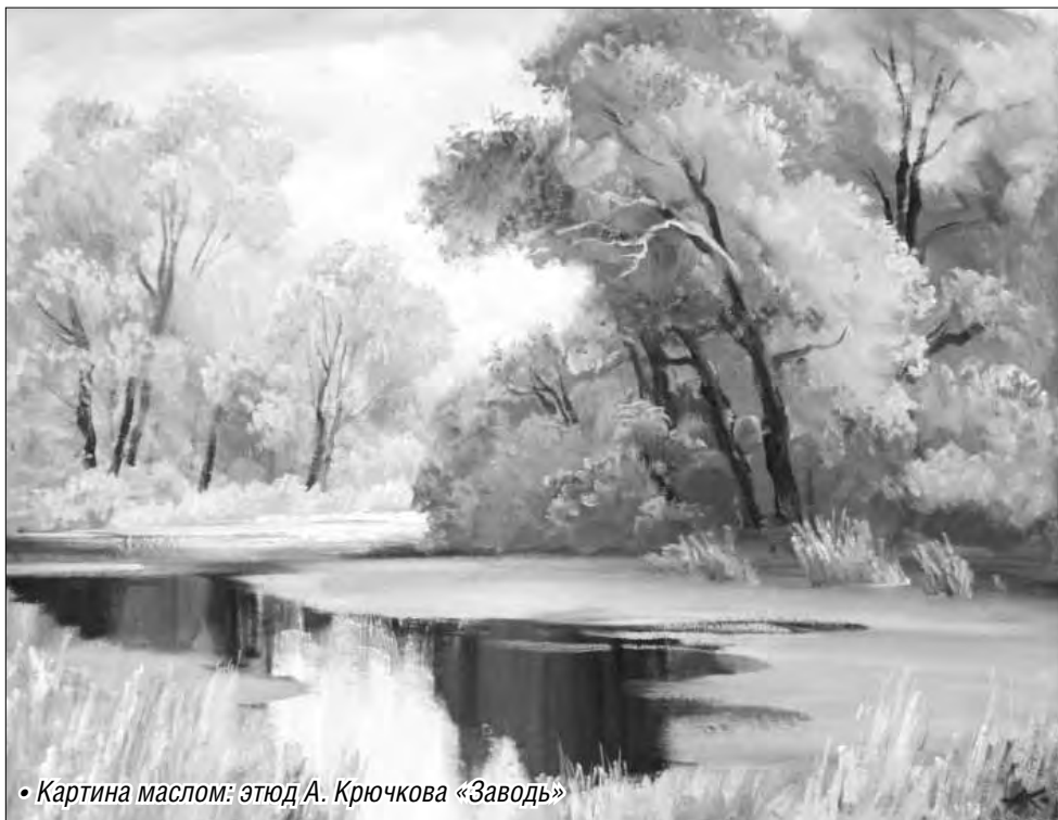
• Картина маслом: этюд А. Крючкова «Заводь»

Новая яркая экспозиция в посвящена самому поэтичному времени года