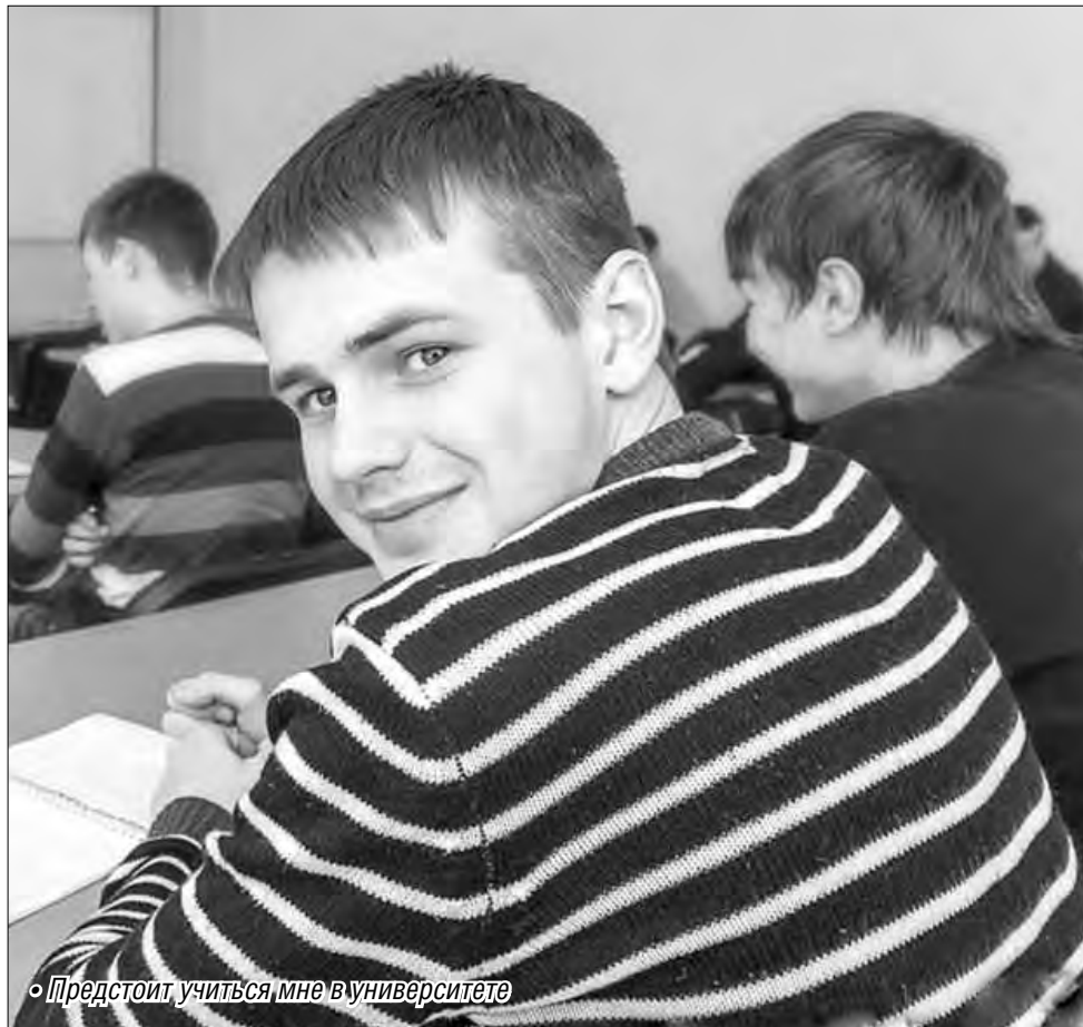
«Предстоит учиться мне в университете»