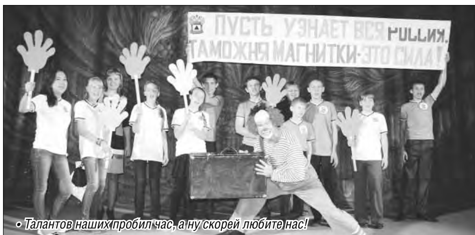
• Талантов наших пробил час, а ну скорей любите нас!