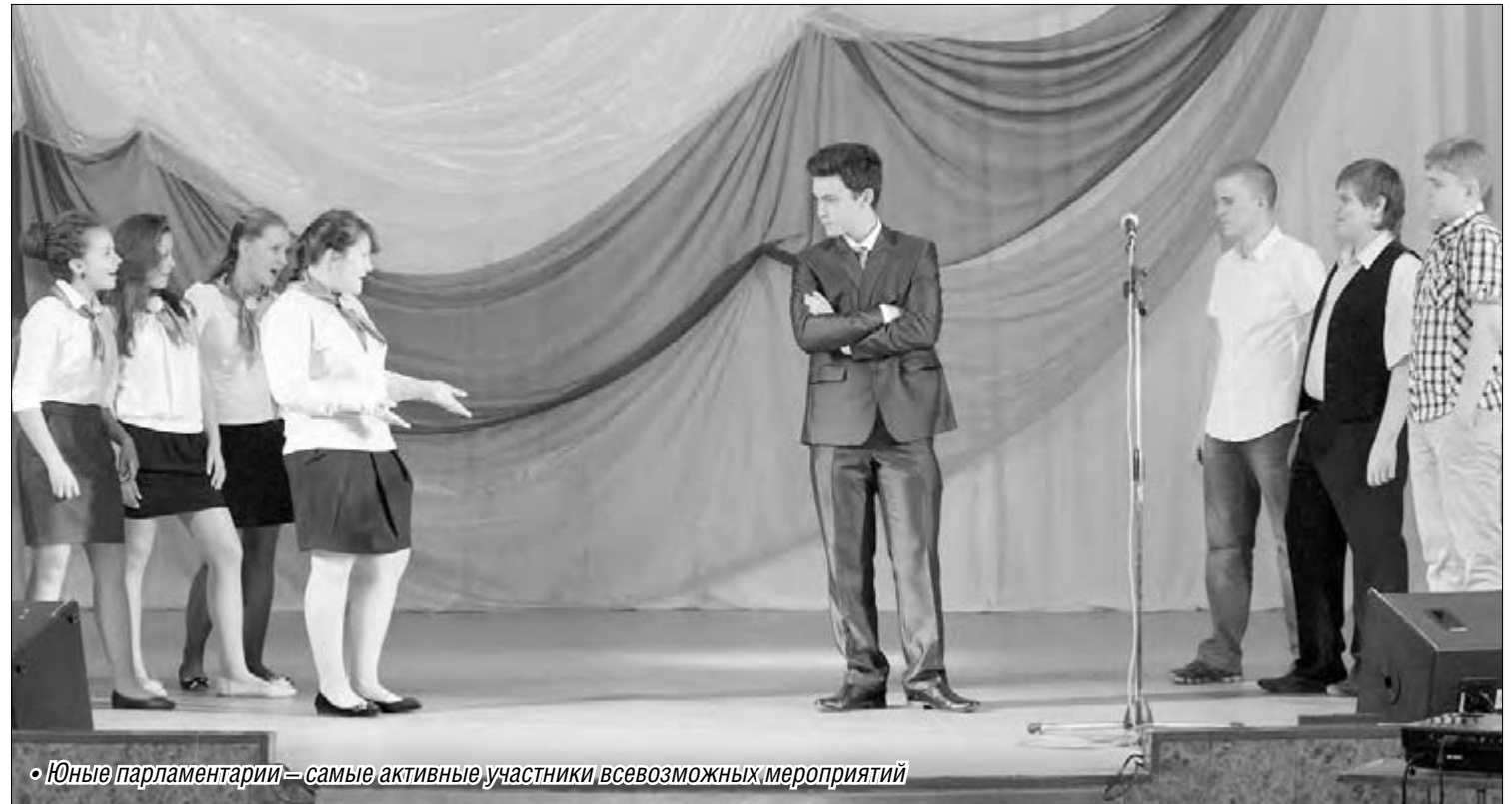
• Юные парламентарии – самые активные участники всевозможных мероприятий