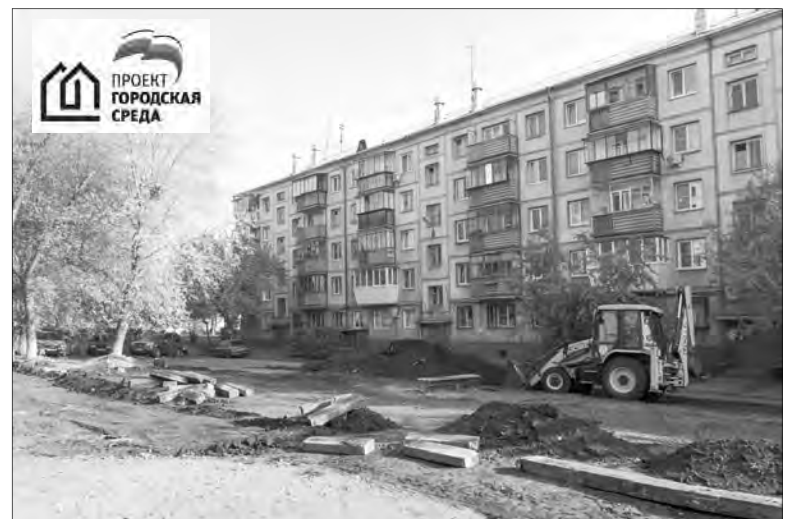
Дорожные работы во дворах должны быть закончены на днях