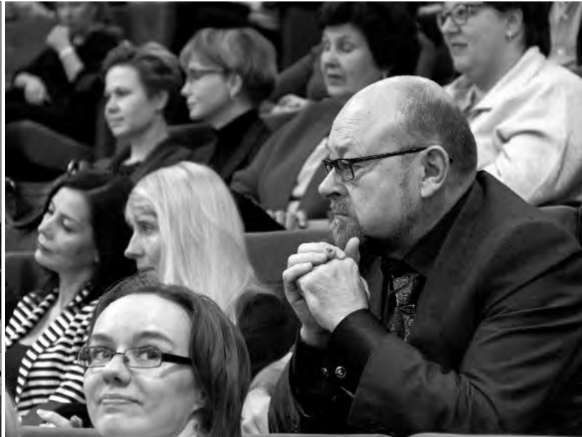
Региональная конференция касалась вопросов, актуальных для всего российского нотариата