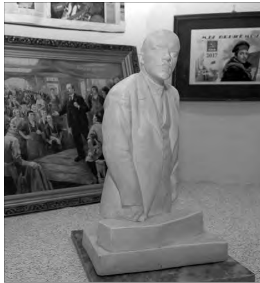
Уроки октябрьской революции по сей день вызывают большой интерес у всех любителей истории