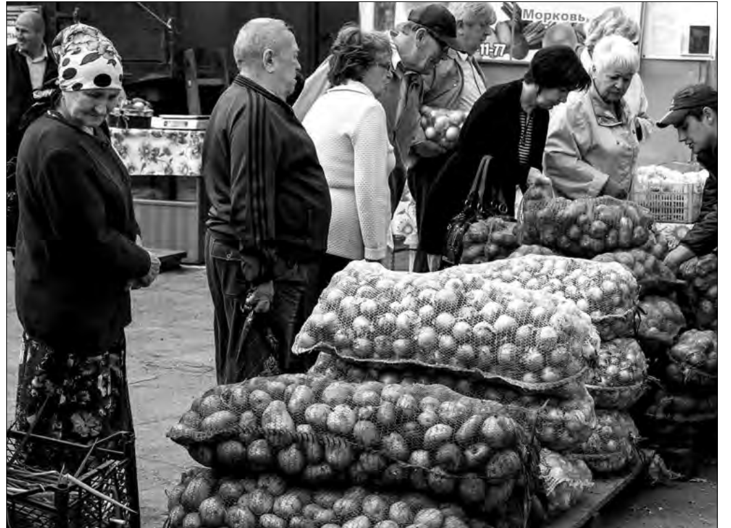
Ярмарки сельхозпродукции давно стали доброй традицией

Помимо сезонной торговли на территории Магнитогорска созданы условия для мобиль-