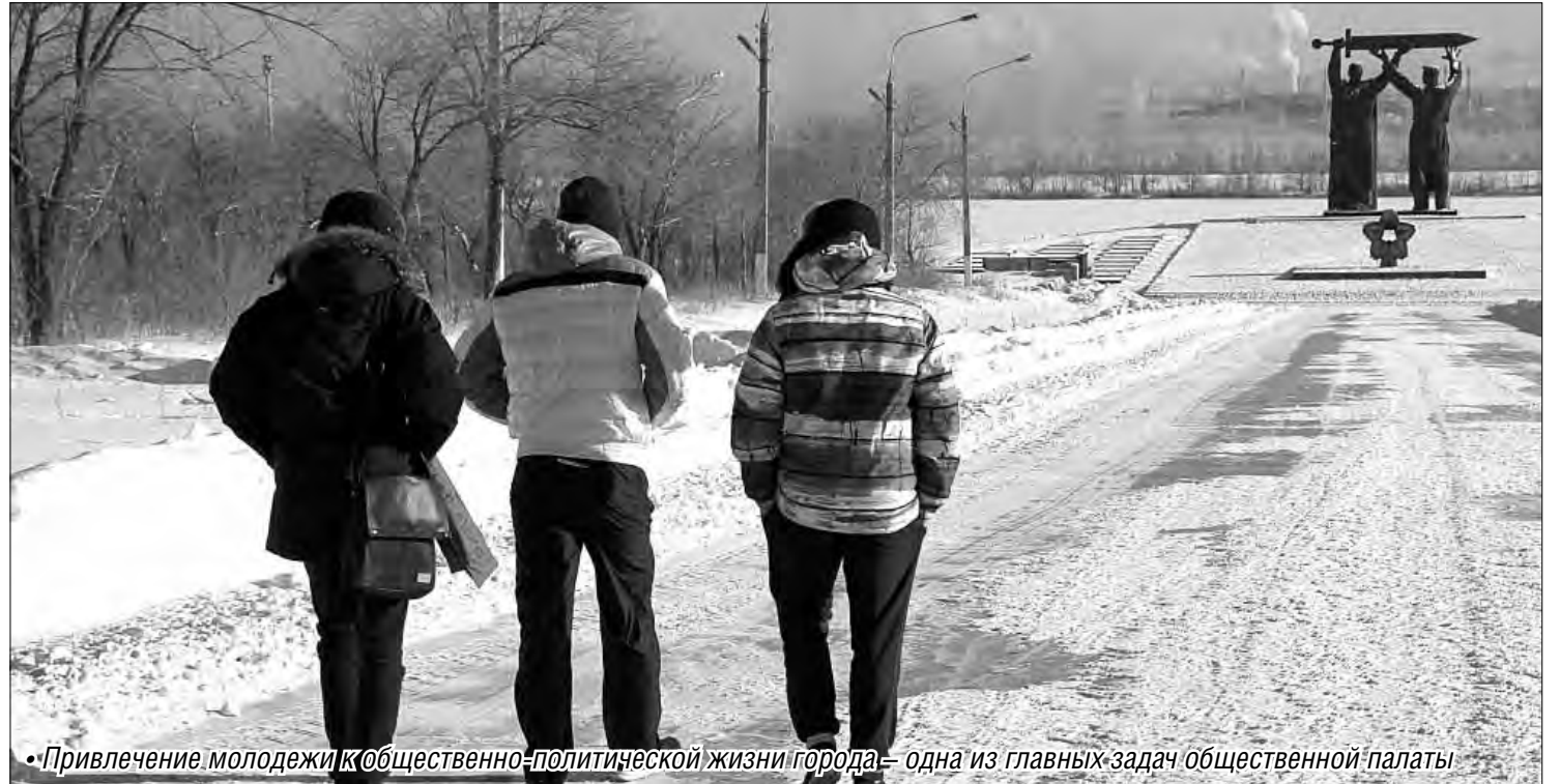
• Привлечение молодежи к общественно-политической жизни города – одна из главных задач общественной палаты

Весенняя сессия «молодежки»: фестиваль социальной рекламы, конкурс сочинений и хоккей на валенках