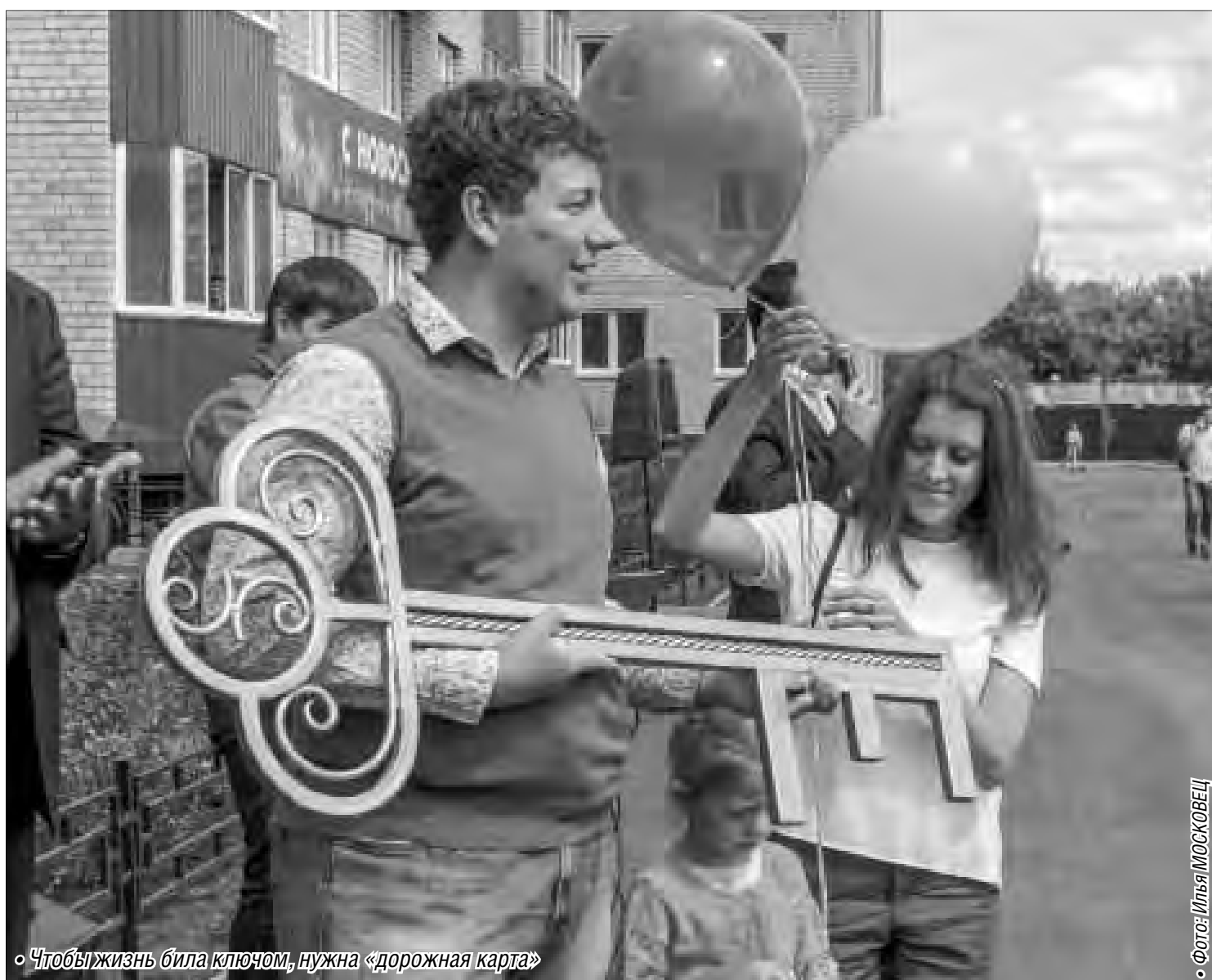
«Чтобы жизнь была ключом, нужна «дорожная карта»