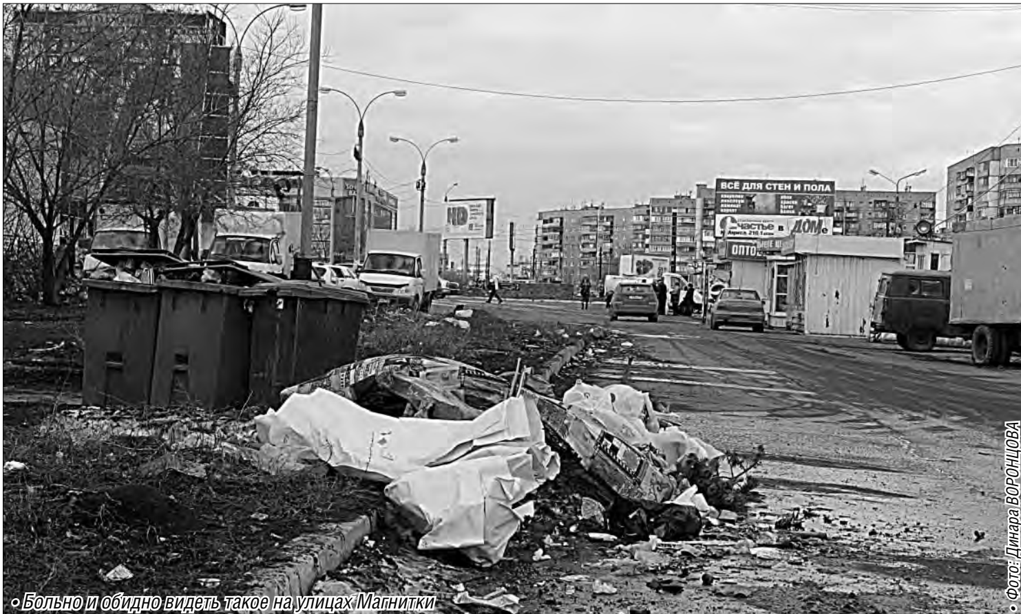
• Больно и обидно видеть такое на улицах Магнитки