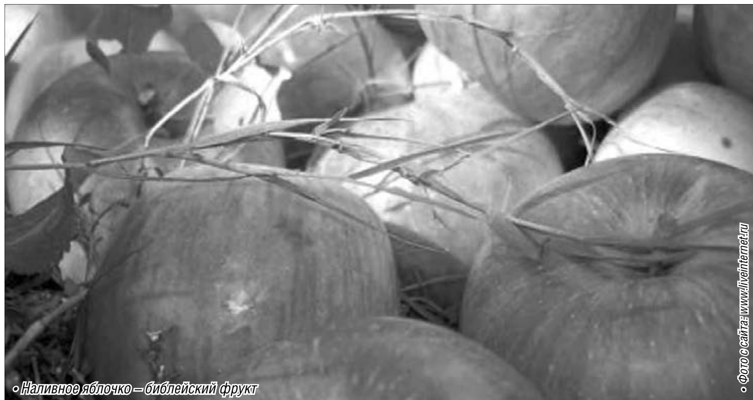
• Наливное яблочко – библейский фрукт