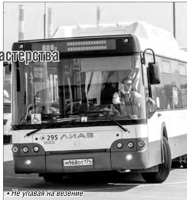
«Не упавая на везение»

...И сама же продемонстрировала наилучшие образцы профподготовки, одержав убедительную победу в упорных состязаниях, которые проходили в два тура и продолжались в течение двух дней. В конкурсе приняли участие 78 асов руля, представлявших 32 территории области.