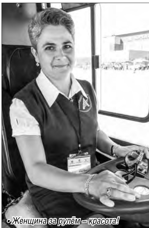
«Женщина за рулем – красота!»