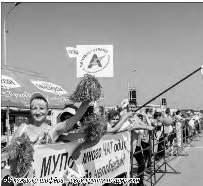
«У каждого шофера – своя группа поддержки»