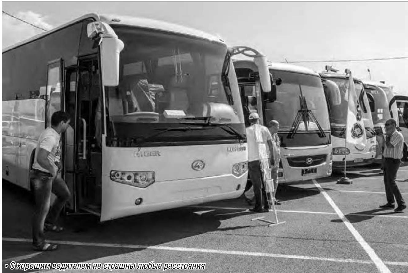
«Хорошим водителем не страшны любые расстояния»

Магнитка приняла участников конкурса профессионального мастерства «Лучший водитель автобуса Челябинской области»