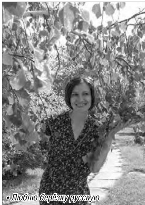
• Люблю берёзку русскую