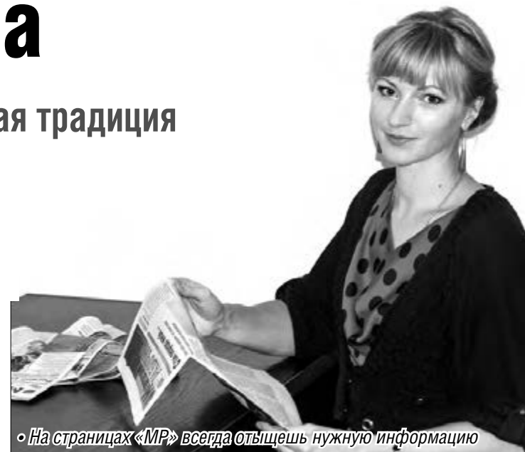
• На страницах «МР» всегда отыщешь нужную информацию