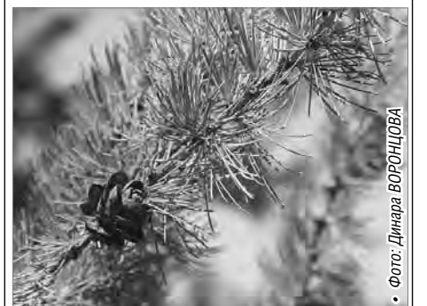
• Фото: Динара ВОРОНЦОВА

Переменная облачность, без осадков. Ветер: юго-западный, 1-2 м/сек. Температура: ночь +13° +15° день +23° +25°