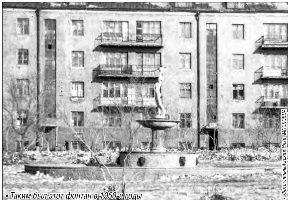
• Таким был этот фонтан в 1950-е годы