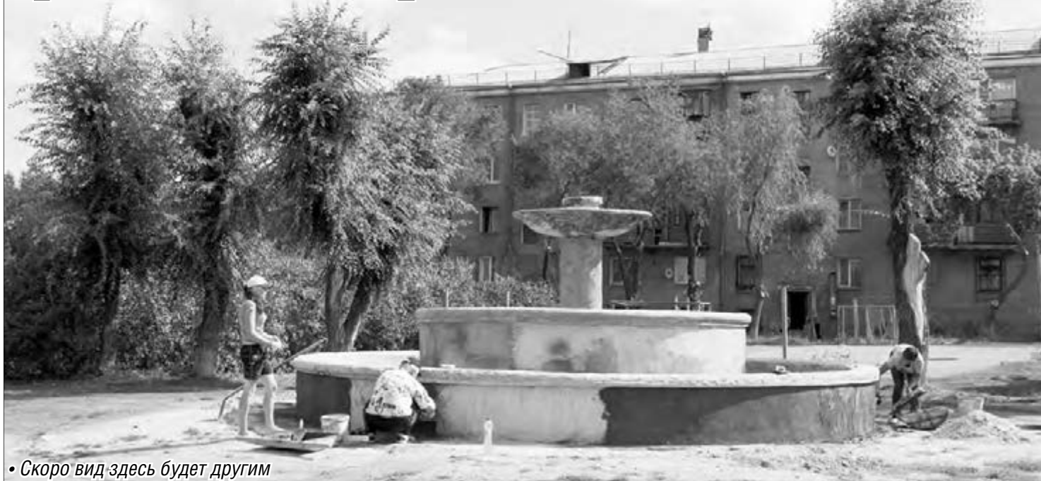
• Скоро вид здесь будет другим