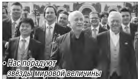
• Нас порадуют звезды мировой величины

«Виртуозы Москвы» планируют выступить в Магнитке.