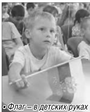
• Флаг – в детских руках

Знакомство с историей создания государственного флага прошло с помощью мультипрезентации. «Песню о Российском флаге» исполнили воспитанники коррекционного детского сада №98. В игре «Передай сердечко и скажи словечко»