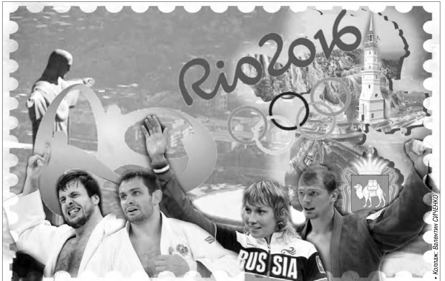
• Коллаж: Валентин СИЧЕНКО

Мы вправе были ожидать от южноуральского стрелка подвигот: Денис Кулаков уже опытный, состоявшийся спортсмен. Разумеется, уже сам факт того, что Кулаков смог