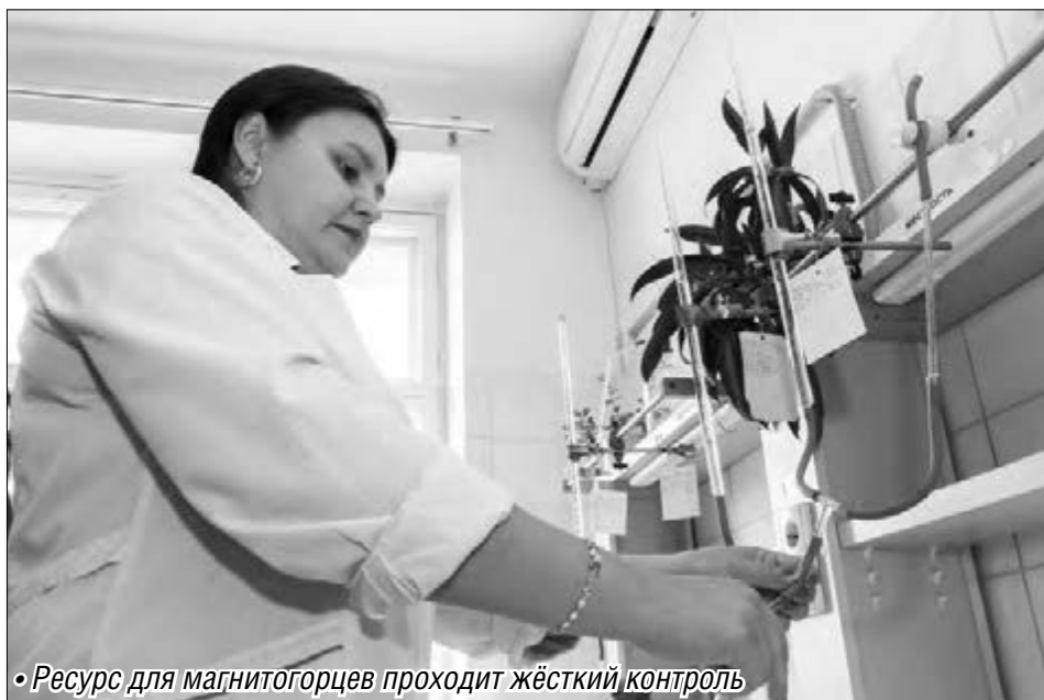
• Ресурс для магнитогорцев проходит жёсткий контроль

В приоритете – улучшение качества воды в левобережье города