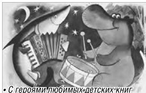
• С героями любимых детских книг

Ко Дню знаний приурочили сотрудники Магнитогорской картинной галереи выставку книжной иллюстрации для детей.