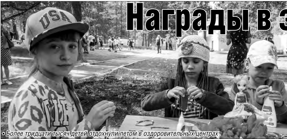
• Более тридцати тысяч детей отдохнули летом в оздоровительных центрах