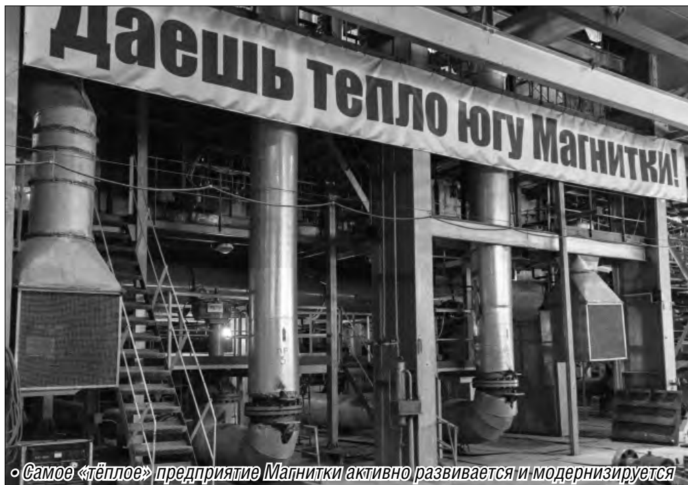
«Самое «тёплое» предприятие Магнитки активно развивается и модернизируется»

Старейшее хозяйственное предприятие Магнитки отметило 80-летие