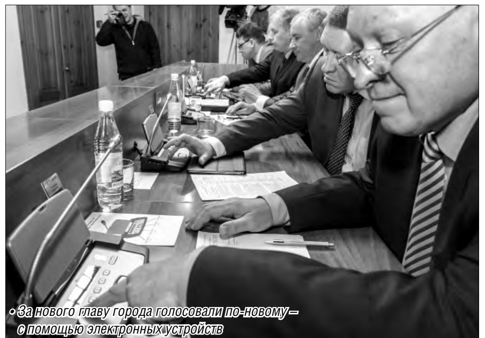
«За нового главу города голосовали по-новому» с помощью электронных устройств

Среди других вопросов, рассмотренных на октябрьском заседании, были и те, решения которых с волнением ждали требующие социальной поддержки группы граждан – пенсионеры, а также учащиеся и студенты. Несмотря на сложную экономическую ситуацию и дефицит бюджета, депутаты пошли на то, чтобы пенсионерам – муниципальным и региональным льготникам сохранить и в 2017 году льготу в виде бесплатного проезда в общественном транспорте в количестве тридцати поездок ежемесячно на основании пластиковой социальной карты. Каждый следующий разовый проезд они будут оплачивать в половинном размере от установленного тарифа. Пересадка в течение часа останется бесплатной. Сохранится на прежнем уровне и цена проездных билетов.