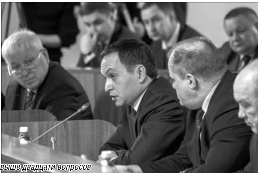
• На ноябрьском заседании депутаты рассмотрели свыше двадцати вопросов

На ноябрьском заседании депутаты МГСД утвердили льготы родителям дошкольников и уделили особое внимание малому и среднему бизнесу.