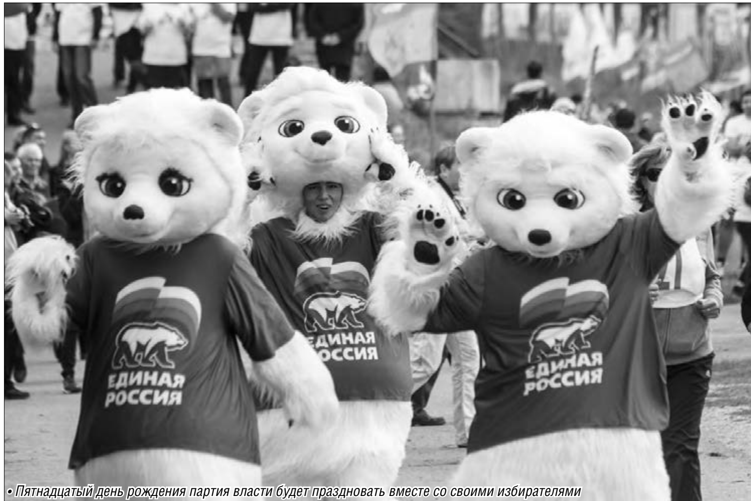
• Пятнадцатый день рождения партия власти будет праздновать вместе со своими избирателями

— Мы признаем, что потеряли некоторый процент партийного влияния, а это значит, что потеряли и часть доверия наших избирателей. Естественно, все встревожены этой ситуацией, ведь на протяжении многих лет мы получали высокую поддержку со стороны южноуральцев. Мы были уверены, что нас поддержат и на этот раз, и недостаточно