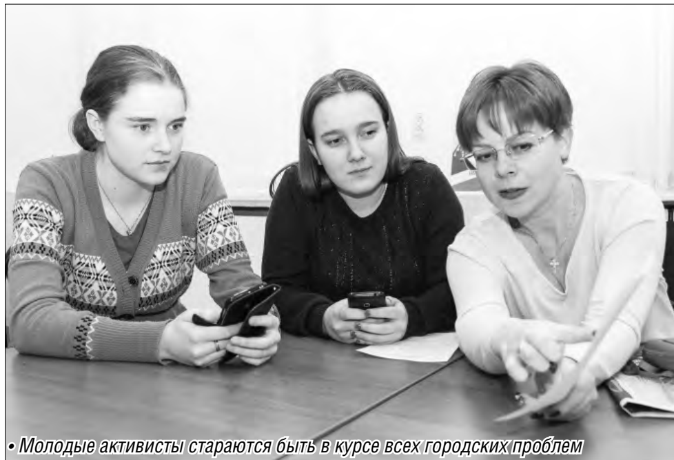
• Молодые активисты стараются быть в курсе всех городских проблем

«Гости в погонах» рассказали аудитории об основных принципах работы интернет-портала www.gosuslugi.ru и возможности регистрации на нем, ответили на вопросы членов молодежной палаты о постановке и снятии с учета транспортных средств и их регистрации через интернет-портал госуслуг, объяснили, как получить документ о наличии или отсутствии судимости и архивные справки. Молодых парламентариев заинтересовала и возможность электронного общения. С помощью Сети молодежь готова охотнее помогать поддерживать правопорядок.