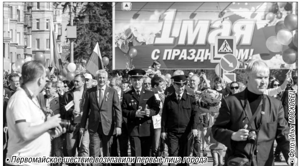
Первомайское шествие возглавили первые лица города

Тем временем из громкоговорителей раздались призывы к построению и общему выступлению. В первых рядах были представители горно-металлургического профсоюза работников ОАО «ММК», именно они уже не первый год являются инициаторами майского шествия. Огромное количество молодых людей несли в руках флаги и транспаранты. За профсоюзами в две параллельные колонны – поток разъединял скверик между улицами Ленинградской и Калинина – вы-