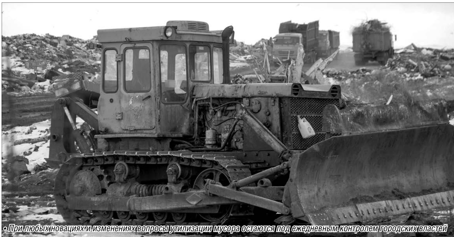
• При любых новациях и изменениях вопросы утилизации мусора остаются под ежедневным контролем городских властей

Грозят ли Магнитогорску проблемы с мусором?