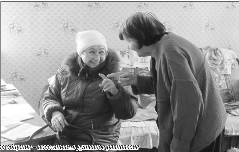
• Компьютерные курсы помогают клиентам центра идти в ногу со временем, а доброе общение — восстановить душевное равновесие

Создание в феврале 1992 года государственного территориального центра социальной защиты населения – так тогда называлось учреждение – совпало с активной законодательной деятельностью по обеспечению льготами нуждающихся категорий населения.