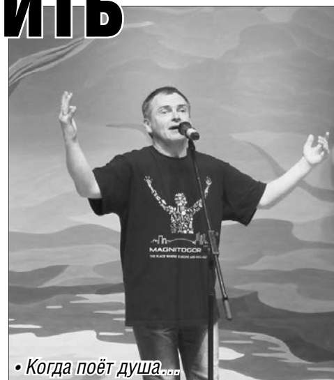
• Когда поёт душа...

– Мы используем комплексный подход при восстановлении здоровья. Структура нашего учреждения подразумевает физическую, психологическую, культурно-досу-