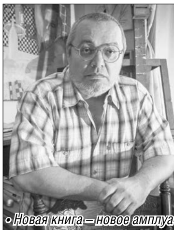
• Новая книга – новое амплу

– Несколько лет назад захотелось попробовать силы в ху-