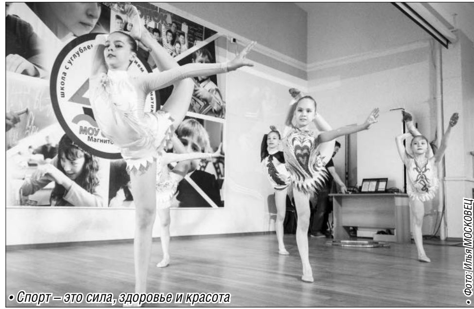
• Спорт – это сила, здоровье и красота

Знаки ГТО получили более 150 учащихся учебных заведений города