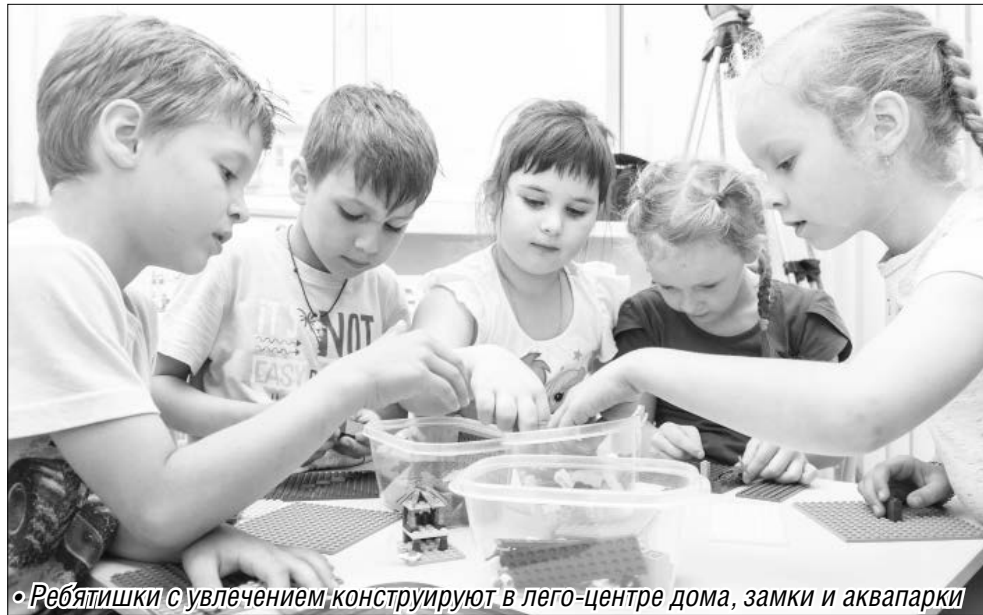
• Ребятушки с увлечением конструируют в лего-центре дома, замки и аквапарки

В ближайших планах депутата, отраженных в реестре наказов избирателей, – обустройство новой спортивной площадки на территории 150-го сада. Это будет мини-стадион с безопасным покрытием, современным оборудованием и зрительскими трибунами, на котором будут проходить