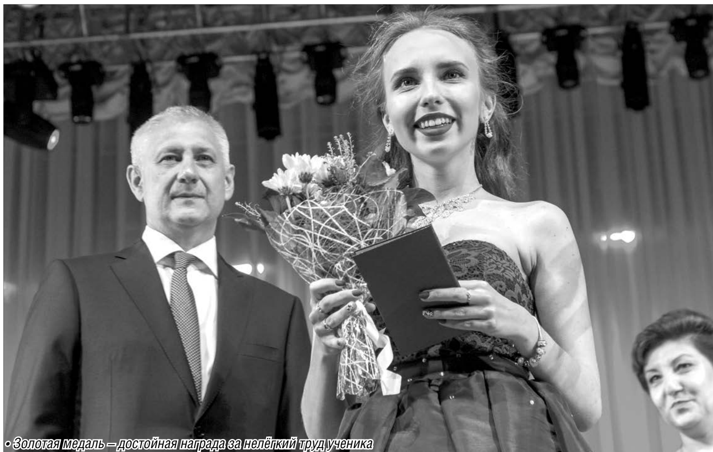
• Золотая медаль — достойная награда за нелёгкий труд ученика

Лучшие выпускники школ получили заслуженные награды