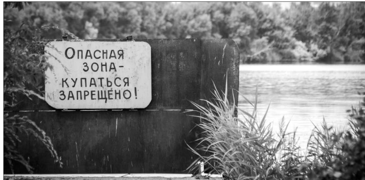
Безрассудства и халатности вода не прощает