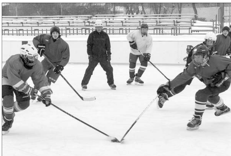
Хоккей – любимая игра миллионов

Известно, что турнир пройдет с 19 по 29 апреля 2018 года. 10 стран-участниц уже распределились по группам. В группу «А», которая сыграет в Магнитогорске, вошли Канада, США, Швеция, Швейцария, Белоруссия. В Челябинске за выход в плей-офф поборются Россия, Финляндия, Словакия, Чехия и Франция, информирует сайт «Первый областной».