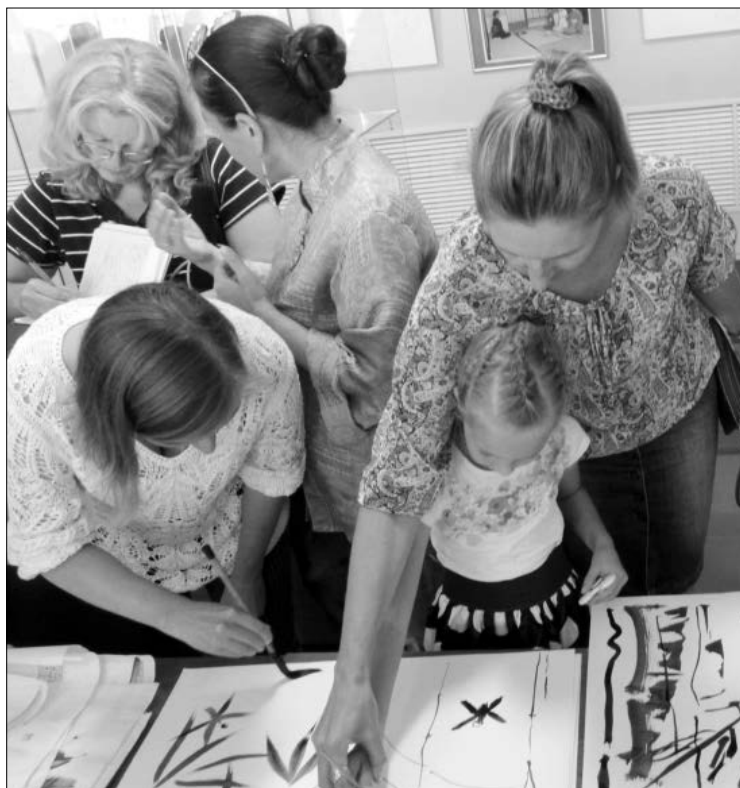
Волшебные краски в умелых руках

Для групп не более 20 человек будут организованы экскурсии по выставкам «Юбиляр – юбиляр», приуроченной к 120-летию со дня рождения художника Георгия Соловьева и 85-летию ММК, «Акварельная палитра», где собраны картины магнитогорского мастера кисти Сергея Наконечного, «Памяти художника», посвященной творчеству Константина Черепанова, экспозиции «Мир японских кукол кокуси». Кроме того, на базе информационно-образовательного центра «Русский музей: виртуальный филиал» юные магнитогорцы смогут совершить виртуальные прогулки и познакомиться с историей возникновения музеев, на примере выдающихся образцов отечественного искусства узнать, что такое пейзаж и какие художники работают в анималистическом жанре. Сотрудники галереи расскажут о традиционных художественных про-