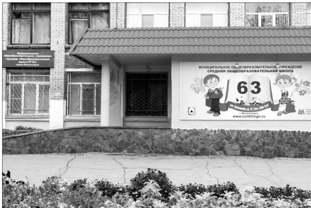
В регионе высок образовательный потенциал

– Мы живем в информационно насыщенном мире, и учреждения образования не могут быть закрытой локальной сферой. По-прежнему важно, чтобы во главе учреждений образования, в органах государственной и муниципальной власти это направление возглавляли люди, хорошо понимающие специфику педагогического про-