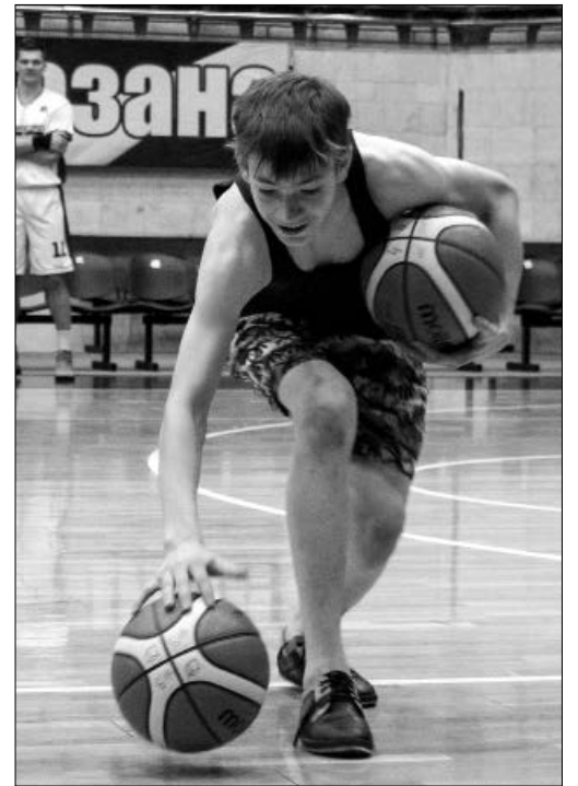
Вот оно – мастерство дриблинга

Несмотря на загруженность, игроки команды «Динамо» в день открытия спортив-