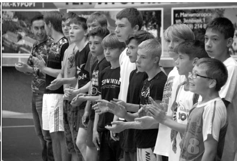
Баскетболу все возрасты покорны