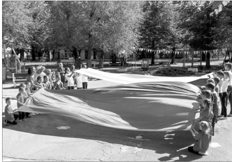
Юные магнитогорцы гордятся российским триколором