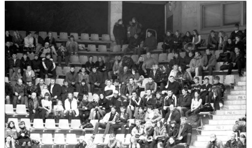
Корректные болельщики – украшение соревнований