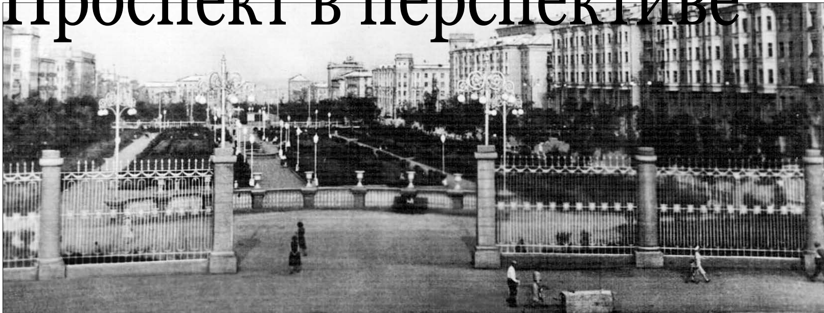
Перспектив Металлургов узнаваем и неповторим