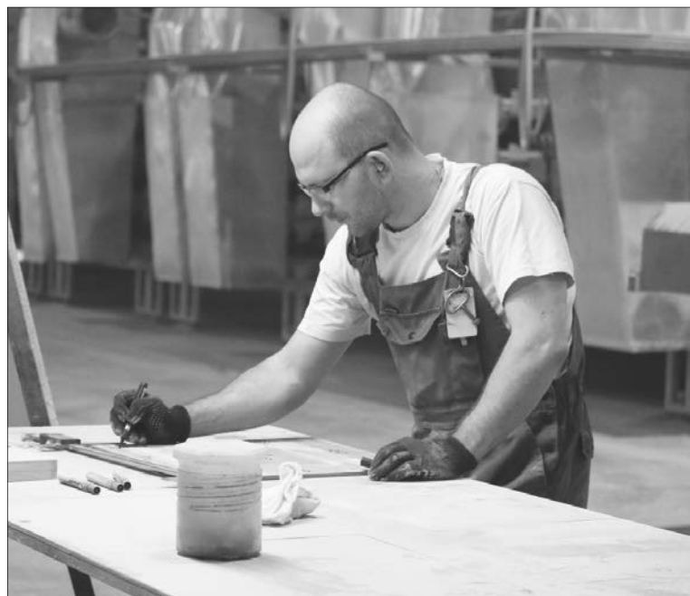
Производство плитки – замкнутый цикл