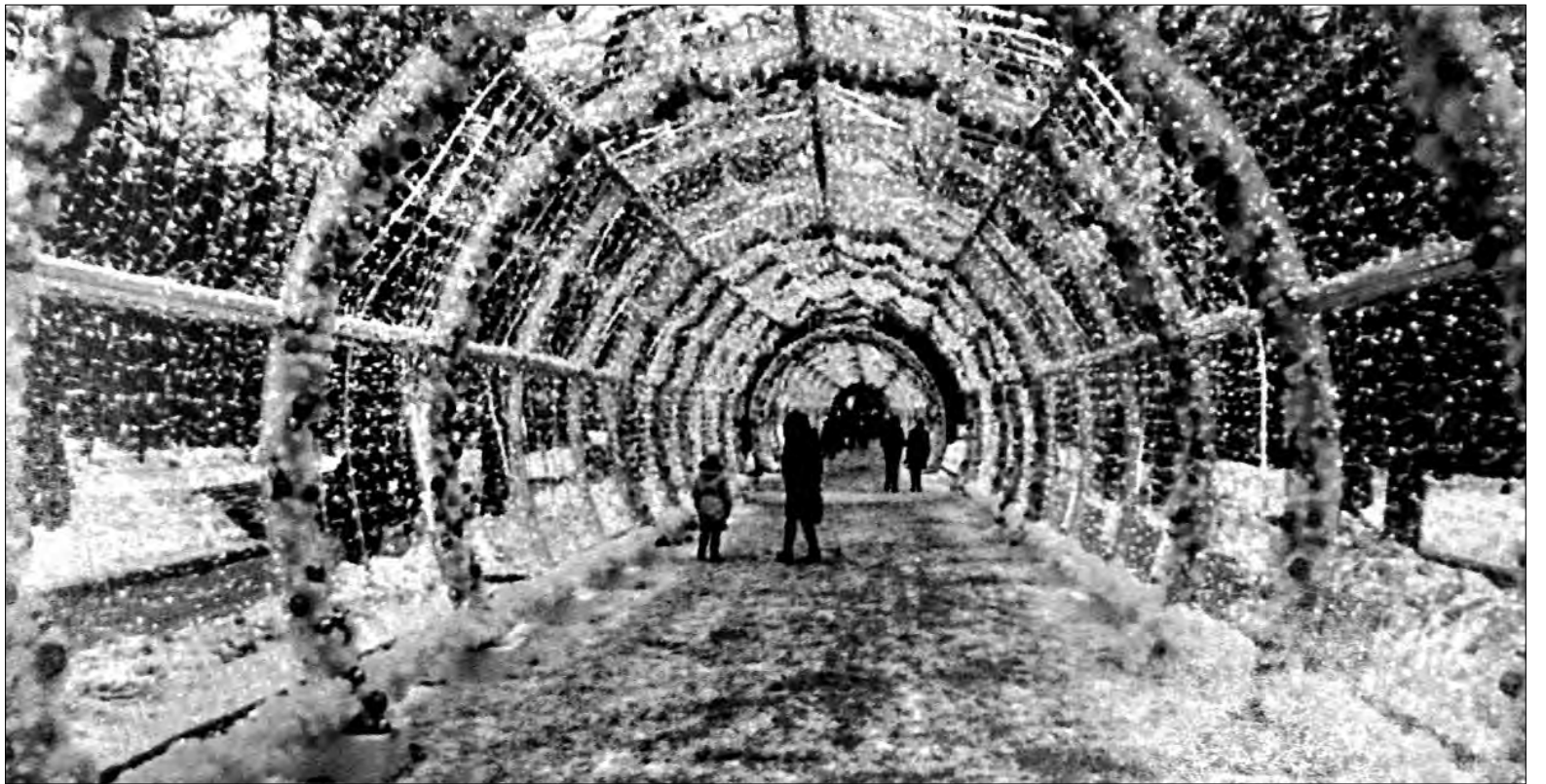
Световая арка на проспекте Metallургов вдохновит на прогулки и фотосессии