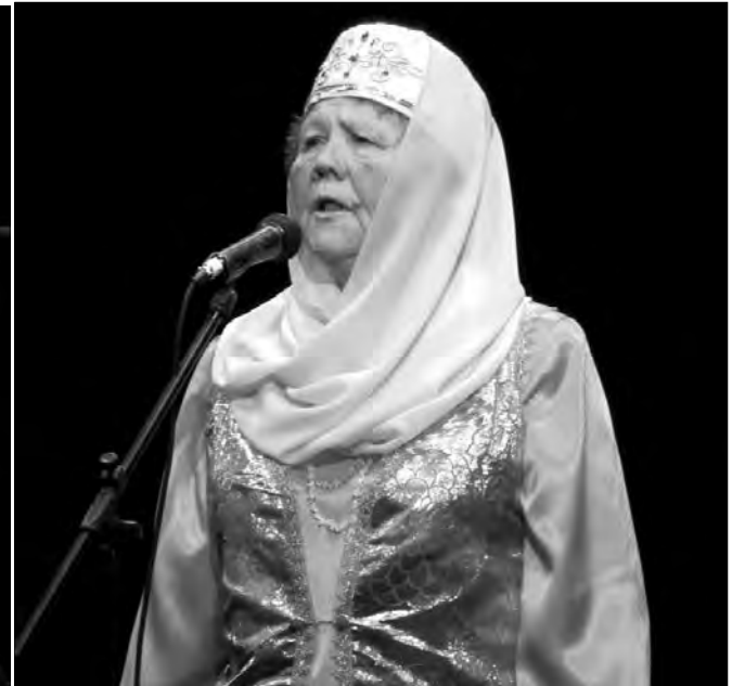
Фестиваль татарского песенного творчества собрал исполнителей от мала до велика