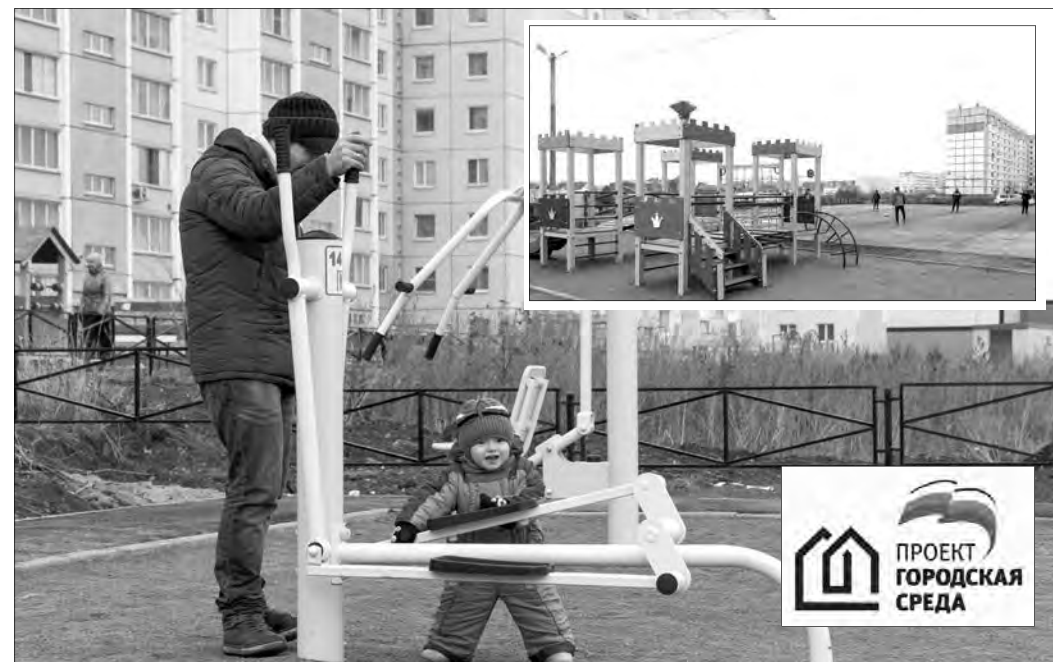
Юные жители дома уже приступили к тренировкам