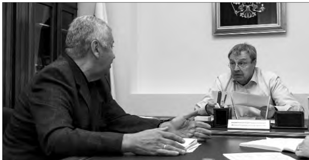
Региональная неделя депутата всегда полна встреч