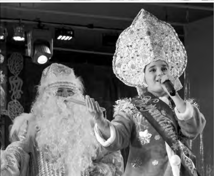
В дружном хороводе и взрослые, и дети

на «Абрис» из центра дополнительного образования «Содружество» сразу можно узнать по отличительному знаку – палитре в форме бабочек на шее. Все пять юных художниц – неоднократные победительницы международных выставок в Москве, Санкт-Петербурге и других городах России.