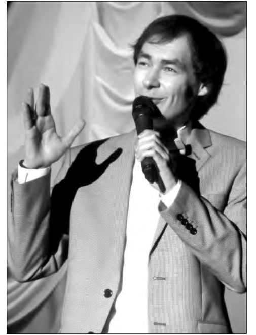
«Спою тебе, моя Магнитка!»