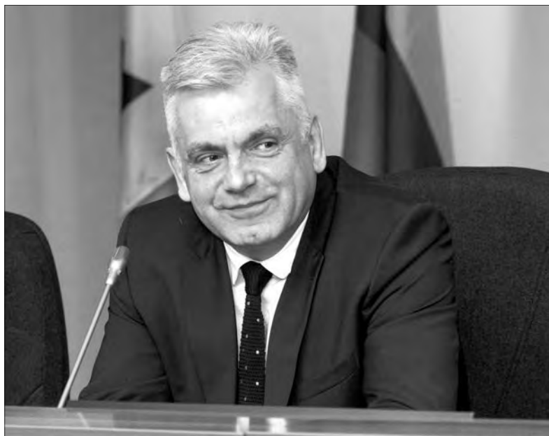
Бюджет приняли, можно улыбнуться