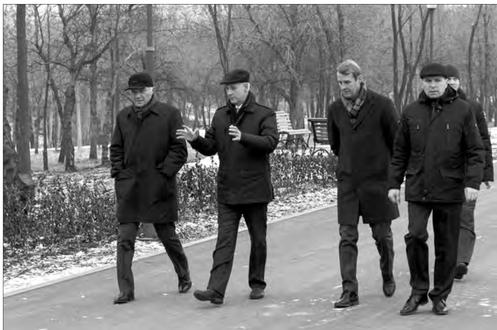
Работа проделана большая, продолжение следует