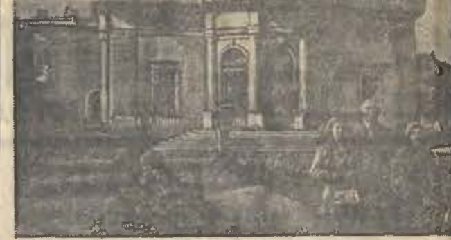
Непривычно для отряда (Валдайская область, УССР) ежегодно пропускает до 10 тыс. отдыхающих. На снимке: общий вид дома отдыха. (Соколов)