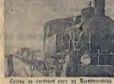
Состав за составом идет на Магнитогорск цехов с готовым проектом. На лето будут изготовлены новые тысячи танков, самолетов, пушек, штыков.