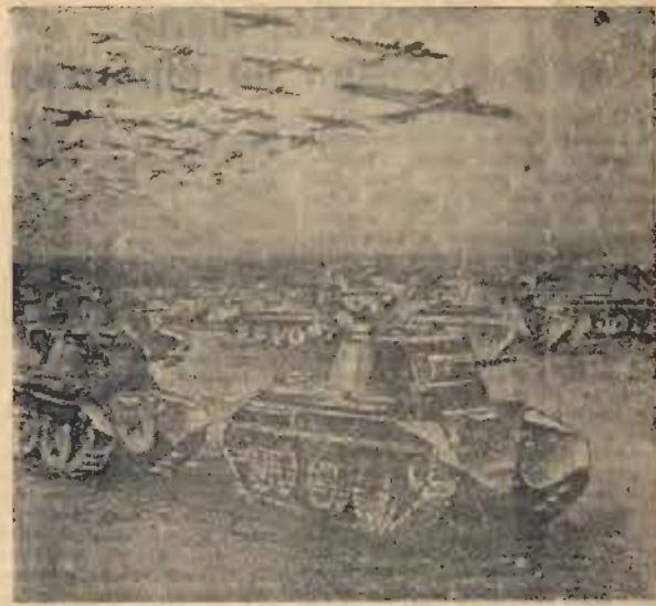
Смуглячьей лавой доверху советские тапки на врага. В создании этих грозных машин мастера и нашего труда.

Товарищи, выплавку стали угрозим! Так Сталин нам наказал. В цеха мы идем, как выходят к бою, И варим отличный металл. Родина-мать сыновьями гордится, И мать сыновьям дорога. Родину нашу, нашу столицу Мы защитим от врага.