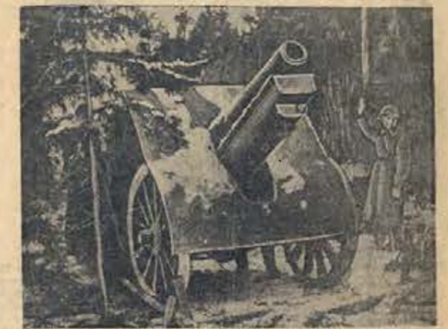
Действующая армия (Северо-Западное направление). На снимке: гаубичная батарея И-ской части на огневой позиции.

В ночь с 12 на 13 декабря наши войска вели бои с противником на всех фронтах. На ряде участков Западного и Юго-Западного фронтов наши части, ведя ожесточенные бои с противником, прорывались вперед и заняли несколько населенных пунктов.