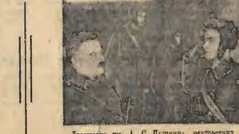
Драмтеатр им. А. С. Пушкина осуществил ряд оборонных спектаклей. На снимке: сцена из постановки «Парень из нашего города».