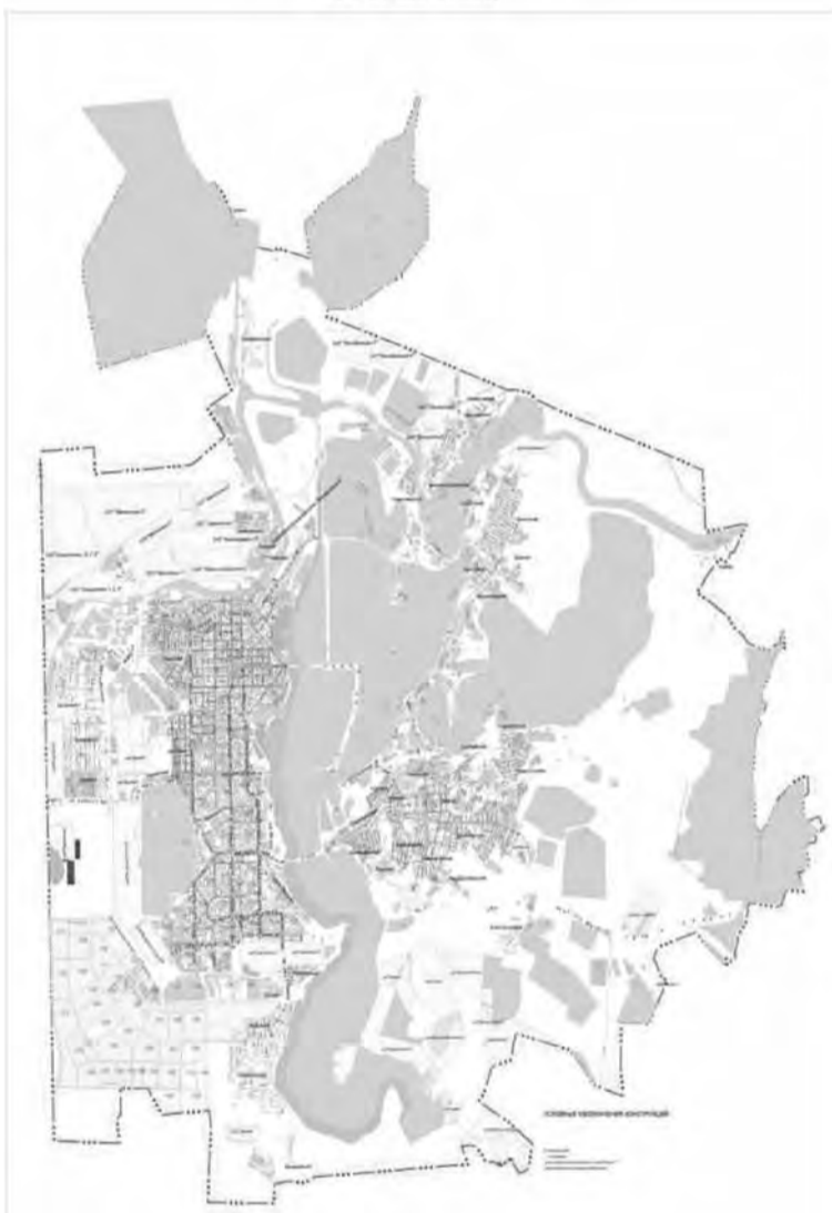
КАРТА РАЗМЕЩЕНИЯ РЕКЛАМНЫХ КОНСТРУКЦИЙ на территории города Магнитогорска

Приложение к постановлению администрации города от 28.06.2019 № 7732 - П Приложение № 2 к постановлению администрации города от 24.01.2014 № 897-П