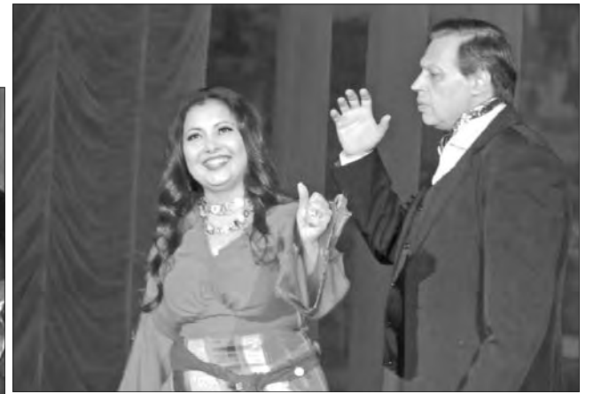
Гала-концерт «Опера против оперетты» завершил сезон в театре оперы и балета