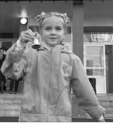
Ещё один голос в перезвоне школьных звонков