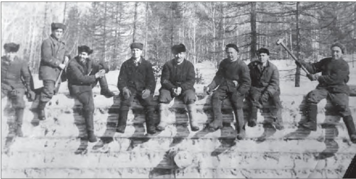
Жители Абзаково трудились на склонах гор, порой с риском для жизни