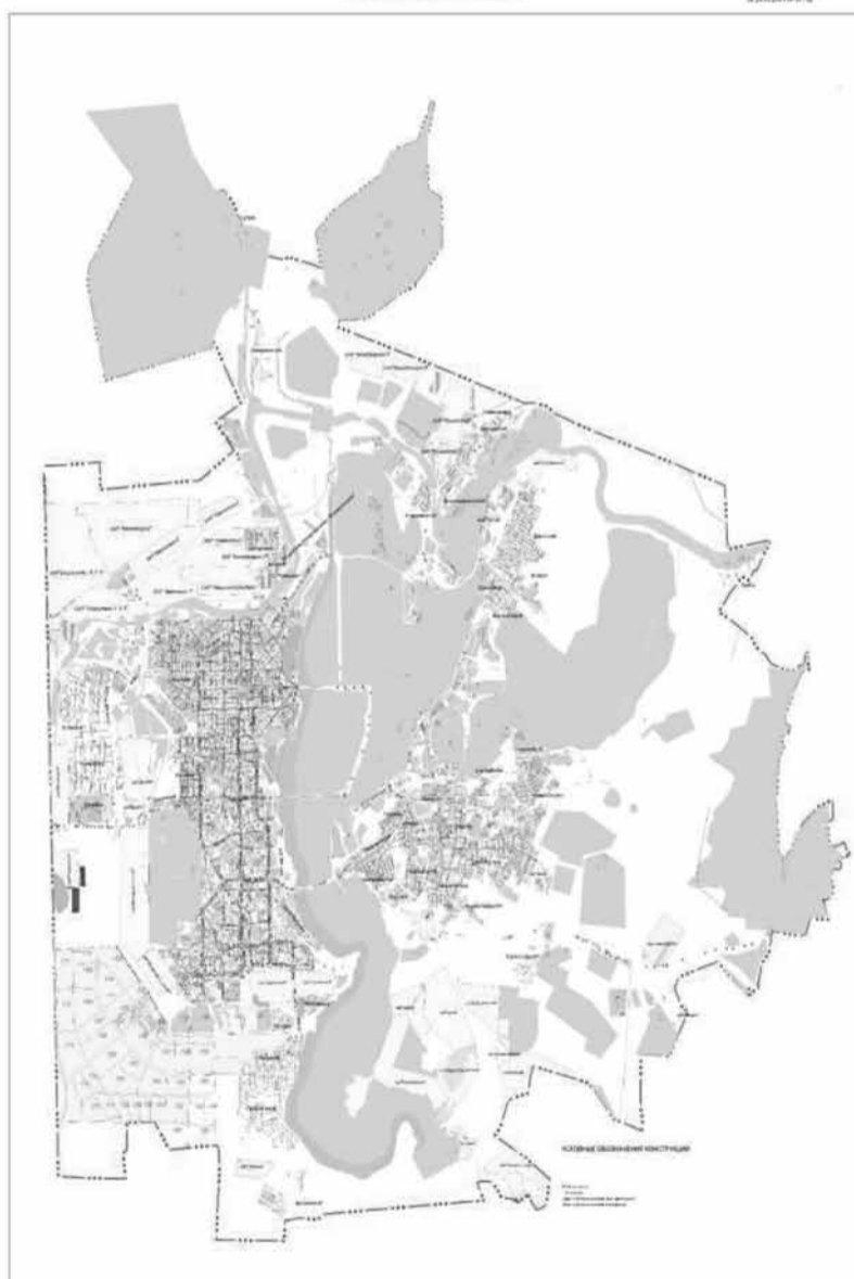
КАРТА РАЗМЕЩЕНИЯ РЕКЛАМНЫХ КОНСТРУКЦИЙ на территории города Магнитогорска