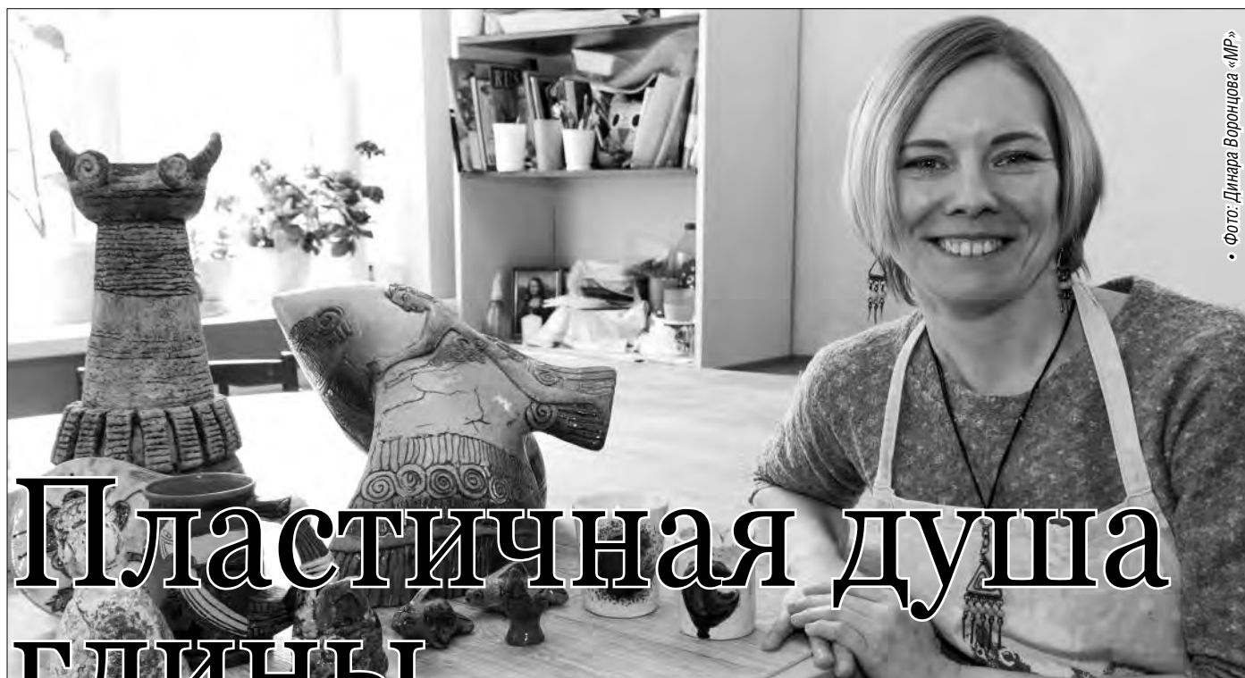
• Фото: Дина Воронцова «МР»