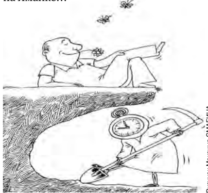
Рисунок: Максимина СМАТГИНА