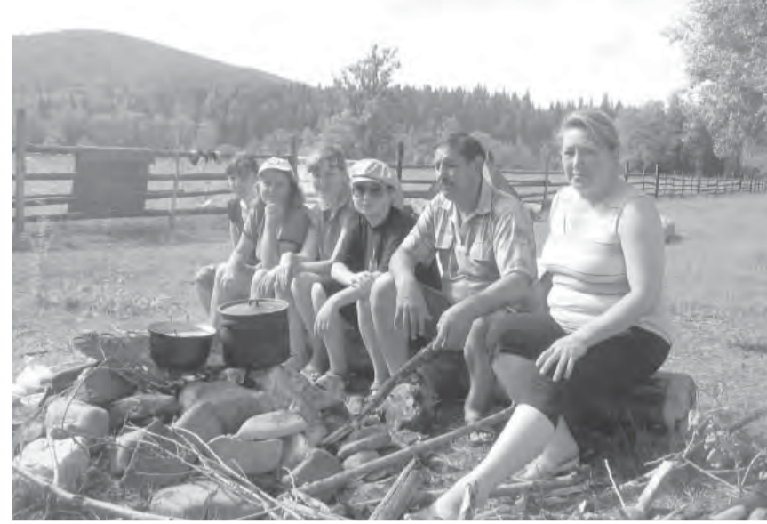
дороге успела опробовать местную черемуху, малину, смородину.

5 день. День озаглавлен 14-километровым походом в Асси.