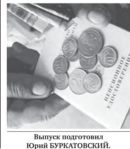
Выпуск подготовил Юрий БУРКАТОВСКИЙ.

Основным документом, подтверждающим стаж, является трудовая книжка. При необходимости подтверждения дополнительных условий требуется написать заявление в территориальный орган ПФР по месту жительства и представить уточняющую справку о вашей трудовой деятельности. Если стаж действительно существует, проблем с его подтверждением возникнуть не должно. В конечном счете все решает суд.