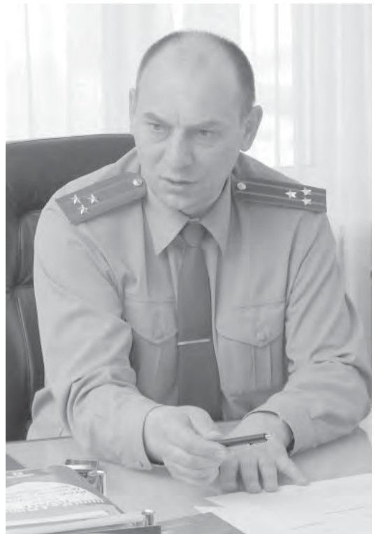
полугодия приходится констатировать их рост на 3 процента.

Преступления против собственности уделяем все больше внимания. Надо однако признать, что меры, принимаемые нами, недостаточны. Если по итогам первого квартала мы отмечали снижение числа имущественных преступлений на 10 процентов, то по итогам