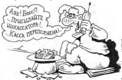
Рисунок Игоря КИРИКО

235 лет назад английский ученый Джозеф Пристли впервые получил чистый кислород. Нам, живущим в эпоху экологических катаклизмов, этого кислорода явно не хватает. Но впадать в уныние от кислородного голодания не стоит, благо есть немало положительных эмоций среди других исторических фактов. Ведь жизнь продолжается, пусть порой и «не слышны в саду даже шорохи», и как приятно до сих пор ласкает слух знакомый и всеми любимый мотив «Подмосковных вечеров», который 1 АВГУСТА ровно 45 лет назад впервые прозвучал в качестве позывного радиостанции «Маяк». А вот на кино- и телеэкранах по случаю своего 75-летия наверняка замаячит самый прикольный «блондин в черном ботинке» – неподражаемый Пьер Ришар. На фоне громкой славы этого комедийного актера заслуги другого юбиляра кажутся более чем скромными, но факт остается фактом: 50-летний канадец Анджей Маковский по сей день значится в истории самым юным человеком, получившим водительские права в возрасте 14 лет 8 месяцев. Список авторекордов этого дня дополняют американские студенты, которые в 1998 г. соорудили самый большой в мире трехколесный велосипед – его высота достигала 7 м 5 см! Кому предназначалось это чудо на колесах, так и осталось загадкой, а вот кому достанутся сегодня все поздравления – известно: свой профессиональный праздник отмечают нынче инкассаторы – люди, которые всегда при деньгах.