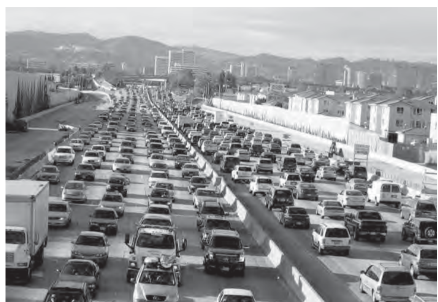
Всемирный банк в конце 2008 года выпустил доклад, посвященный природоохранной деятельности в РФ, в котором отмечается, что на долю автомобильного транспорта приходится около 42 процентов суммарных по России выбросов загрязняющих веществ в атмосферу и 94,5 процента – от транспортного комплекса.

Кроме того, в соответствии с подписанным постановлением, дизельное топливо классов «Евро-2» и «Евро-3» будет выпускаться в России до 31 декабря 2011 года, класса «Евро-4» – до 31 декабря 2014 года. Производство дизельного топлива по стандарту «Евро-5» не ограничено. По мнению Блокова, необходимо ликвидировать пробки и решить вопросы малого потребления топлива. «В России пока рано переходить на альтернативное топливо для автомобилей – отсутствует необходимая инфраструктура. Но можно перейти на спирт как топливо для автомашин. Это потребует минимальных технических усовершенствований», – отметил эколог.