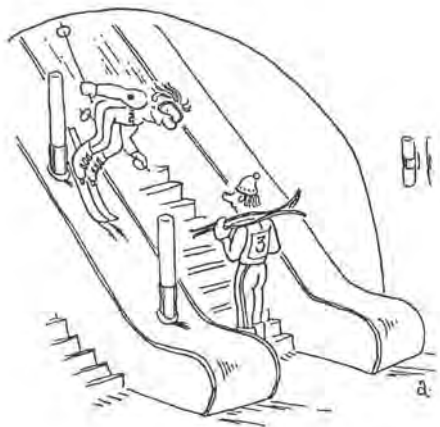
Рисунок Василия Александрова.

Умный в гору не пойдет, умный гору обойдет – наверняка этот постулат придумали рожденные ползать. Поднимись они хотя бы раз на горную вершину, зов высоты уже не покидал бы их никогда. 100 лет назад – 3 АПРЕЛЯ 1910 года – впервые была покорена высочайшая точка Северной Америки Мак-Кинли (6193 м) на Аляске. В этот же день 1933 года человек впервые перелетел на самолете через Эверест, еще раз убедившись, что лучше гор могут быть только горы. Незабываемые виды, искрящиеся ледники и суровые метели, адреналин в крови – для профессиональных скалолазов это просто праздник какой-то! Большинство же из нас в качестве среды обитания предпочитает ровные поверхности, а самое главное, восхождение в своей жизни мы можем совершить разве что на шестнадцатый этаж – когда лифт не работает. И пускай между подобным карабканьем вверх и альпинизмом все еще не установлены родственные связи, что может помешать устремленному ввысь человеку хотя бы один день в году почувствовать себя настоящим покорителем горных вершин?