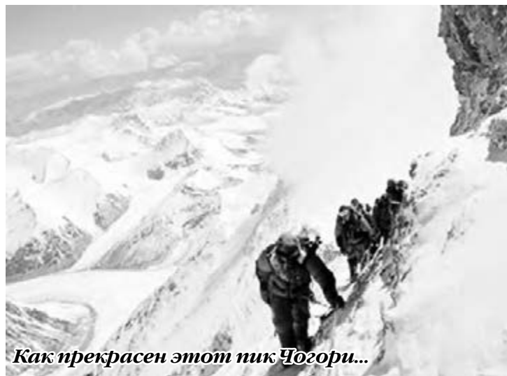
Как прекрасен этот пик Чогори...

Нанга-Парбат (Пакистан, 8126 м) – девятая по высоте вершина мира, конкурирующая в плане сложности с горой Чогори, считающейся самой труднодоступной в мире. Снежные склоны ее круто обрываются со всех сто-