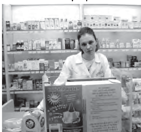
верки, прошедшие после 1 апреля уже более чем в 3000 аптек, показали, что и списки с предельными розничными ценами есть далеко не везде, да и сами ценники кое-где поменять не успели или не захотели. Эксперты не раз говорили о том, что основные ценовые накрутки происходят

При этом в регионах местные руководители здравоохранения (а вслед за ними и представители фармынка) оказались менее расторопными, чем в столице. Про-