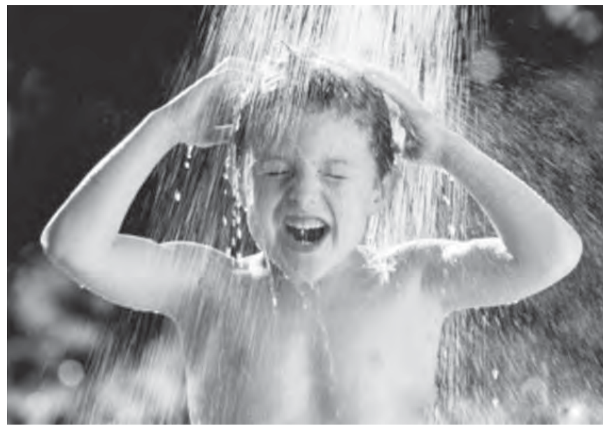
● Закаляйся смолоду.

тина в чем-то экстремальная. Не все родители решатся будить ребенка среди ночи для обливания и вообще обливать его холодной водой во время приступа астмы.