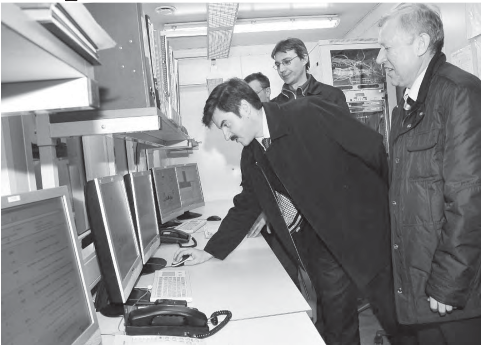
• Новые энергомощности – экологично, надежно, инвестиционно привлекательно.