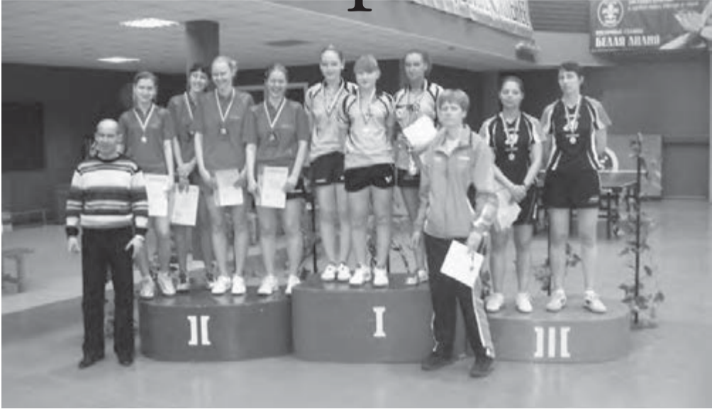
«Металлург-Олимпия» на пьедестале вместе с другими победителями тура.

На стендах клуба в дисциплине «бouldering» состязались около сорока спортсме-