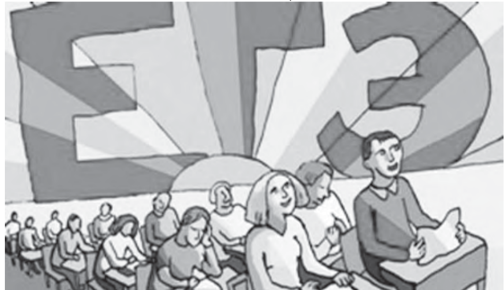
● С ЕГЭ жить стало лучше, жить стало веселее, уверены в Министерстве образования и науки.

В Магнитогорске значительно больше зарегистрировалось участников ЕГЭ по предметам естественно-научного блока. По сравнению с 2009 годом намного больше стало желающих сдать химию и физику. Обществознание, как и в прошлом году, по популярности лидирует среди предметов по выбору, его будут сдавать 1002 человека. Единый экзамен по русскому языку планируют сдавать свыше двух тысяч человек (2158), по математике – 2016 человек.