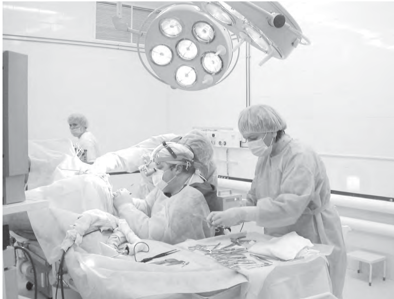
• Медицину надо финансировать полным рублем.