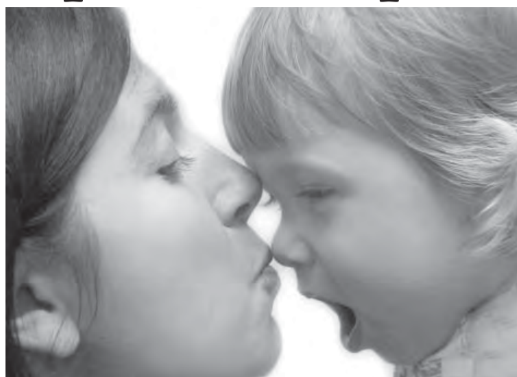
● Материнский капитал – это дети.

«На некоторые шаги можно было бы пойти. Возможно предусмотреть использование