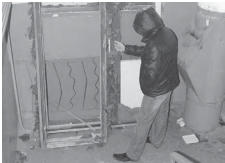
● В «нехорошем» подъезде.

Комиссия по экономической и бюджетной политике Миасского Собрания депутатов рекомендовала администрации города предусмотреть в бюджете 2011 года средства, необходимые для разработки проекта скалодрома. Предполагается, что на эти цели потратится муниципалитет, а непосредственно на строительство спортивного объекта площадью 5600 квадратных метров и примерной стоимостью 250,2 миллиона рублей – казна Челябинской области и федеральный центр. Миасские спортсмены-скалолазы имеют все шансы стать олимпийцами, ведь недавно скалолазание получило статус олимпийского вида спорта. Препятствие одно – отсутствие современной базы для тренировок и проведения соревнований.