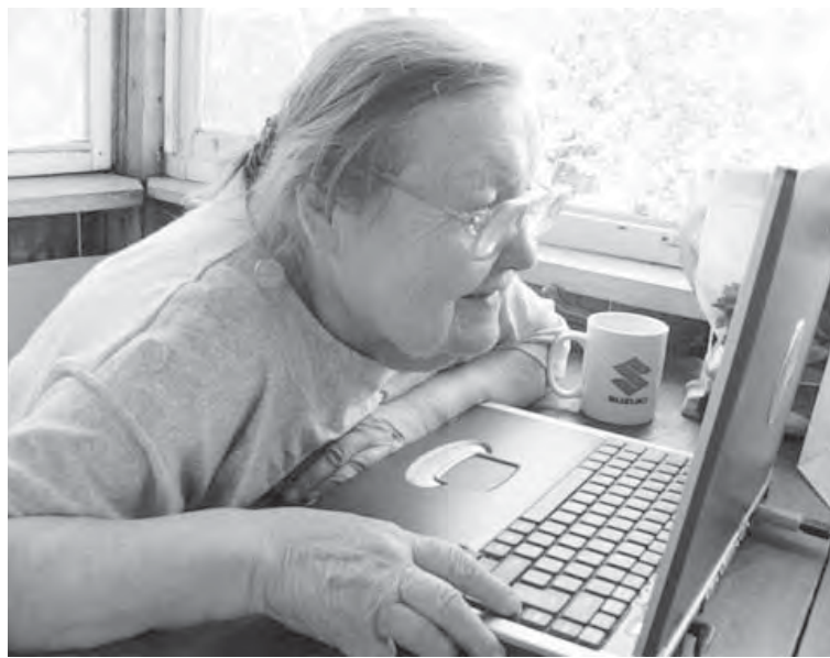
● Компьютер по плечу и бабушке.