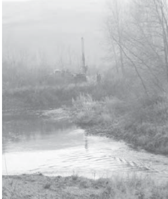
В пойме Урала сейчас идут изыскательские работы.

В Магнитогорске более 100 тысяч квартир. В каждой не менее двух кранов и туалет. 25 процентов