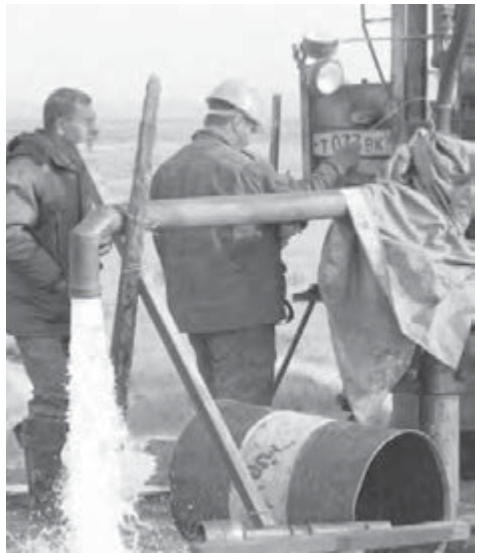
Уральская гидрогеодическая экспедиция за бурением скважин.

Сегодня, пожалуй, всех интересует главный вопрос: так сколько же воды осталось в водоносных пластах водозаборов Магнитогорска? К сожалению, ни гидрогеологи, ни специалисты треста «Водоканал» сказать точно не могут. Ведь подземные источники – «дышащая» система. Куда впадают и откуда вытекают подземные реки и озера – одному Богу известно. Нарушить подземный баланс просто, а удачи ли восстановить его? В Центральной России, к примеру, несколько населенных пунктов остались вообще без воды. Бесконтрольное использование