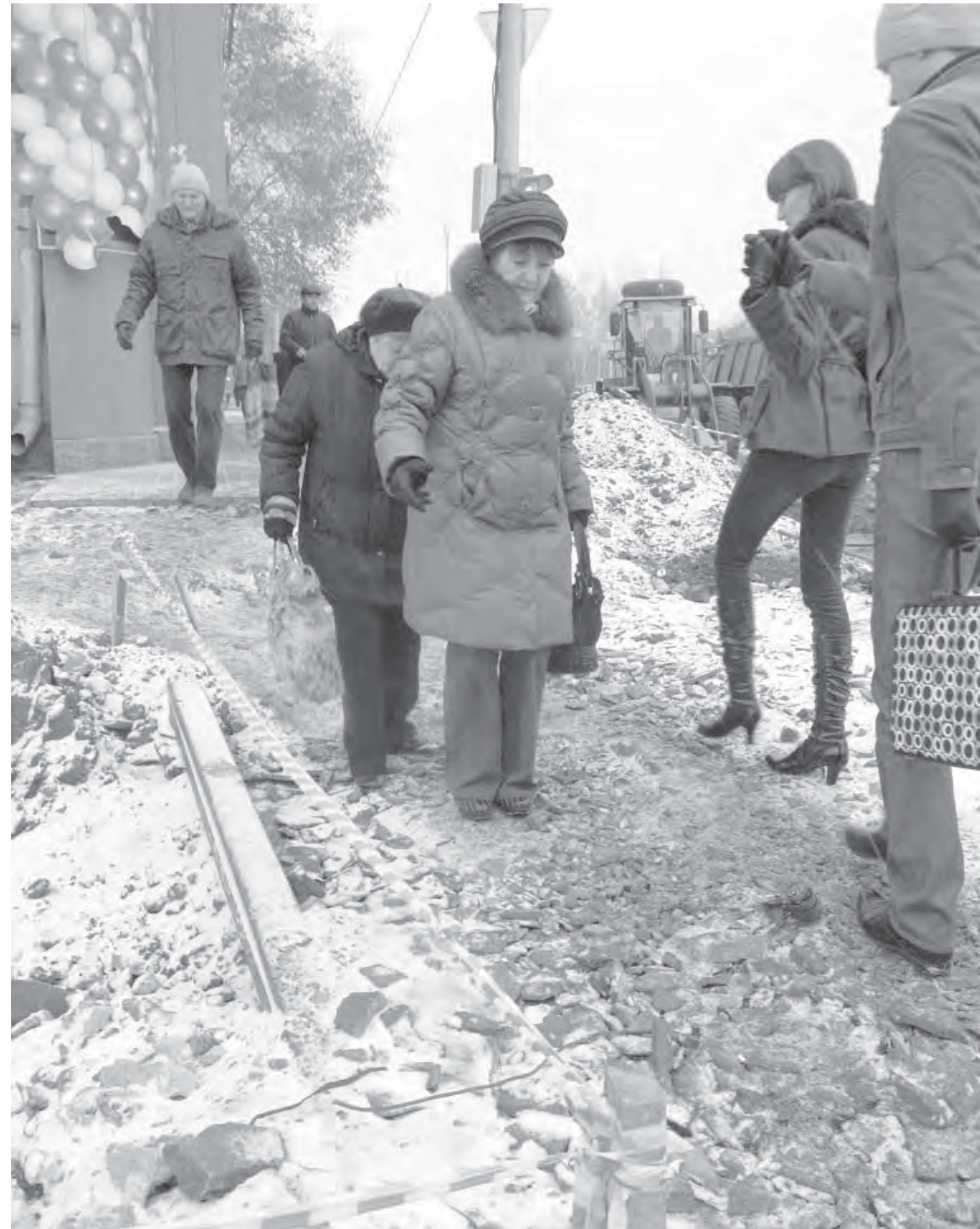
● О пешеходах кто-то подумал?

– Я живу в районе улицы Суворова, а свекровь, которая слегла после инсульта, – по Гагарина, рядом с домом, где идет ремонт. В течение дня мне несколько раз приходится преодолевать аварийный участок. Сделать это вместе с ребенком до университета детской коляской – подвиг. Там здоровый-то человек рискует сломать ноги, что уж говорить о мамочке с коляской: камни