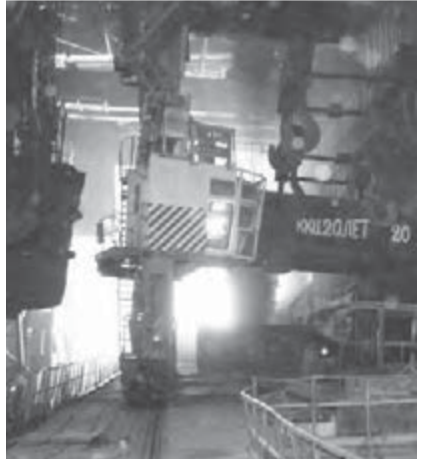
● Идет сталь для ЛПЦ-5.