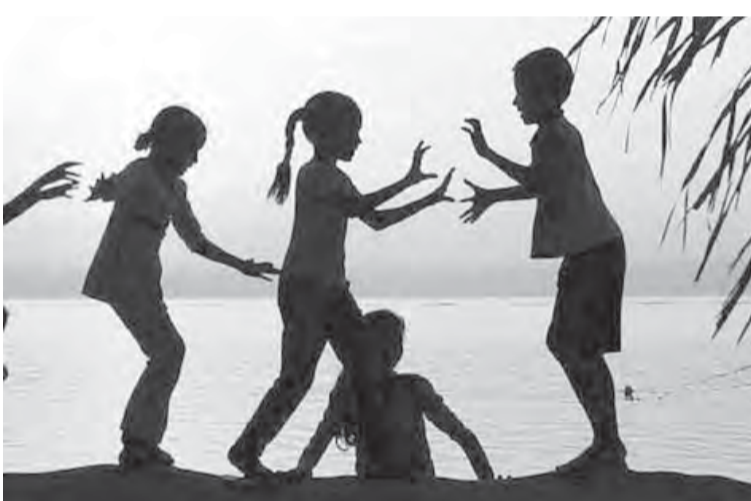
Ах, лето красное...

На финансирование летнего детского отдыха в 2010 году было выделено более 184,5 млн. руб-