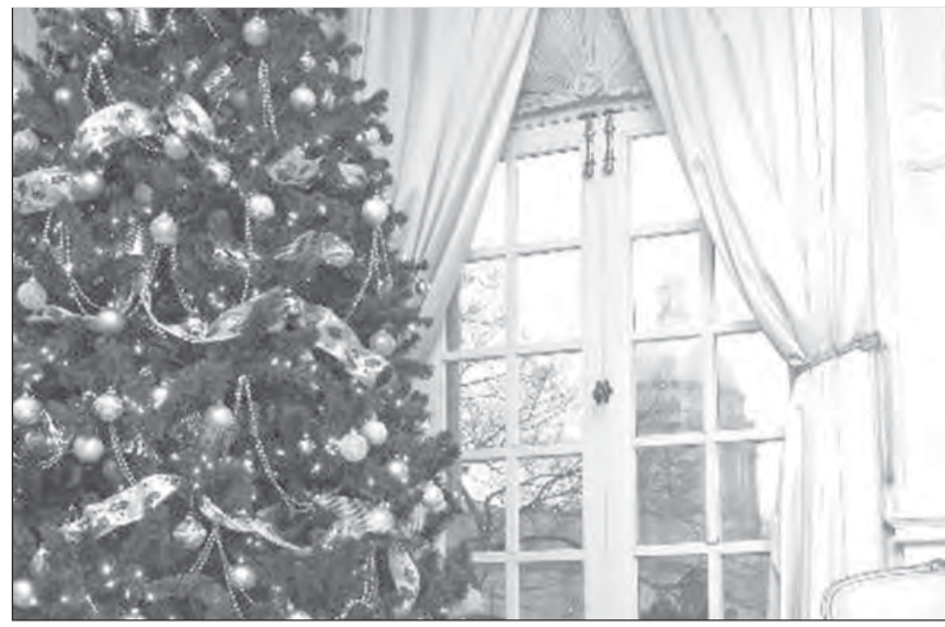
«Разноцветные огни на пушистой елке...»

«сделано в Китае», правда, изредка можно обнаружить товар и представителей российского и заморского бизнеса. В Магнитогорске нам удалось отыскать украшения московского производителя.