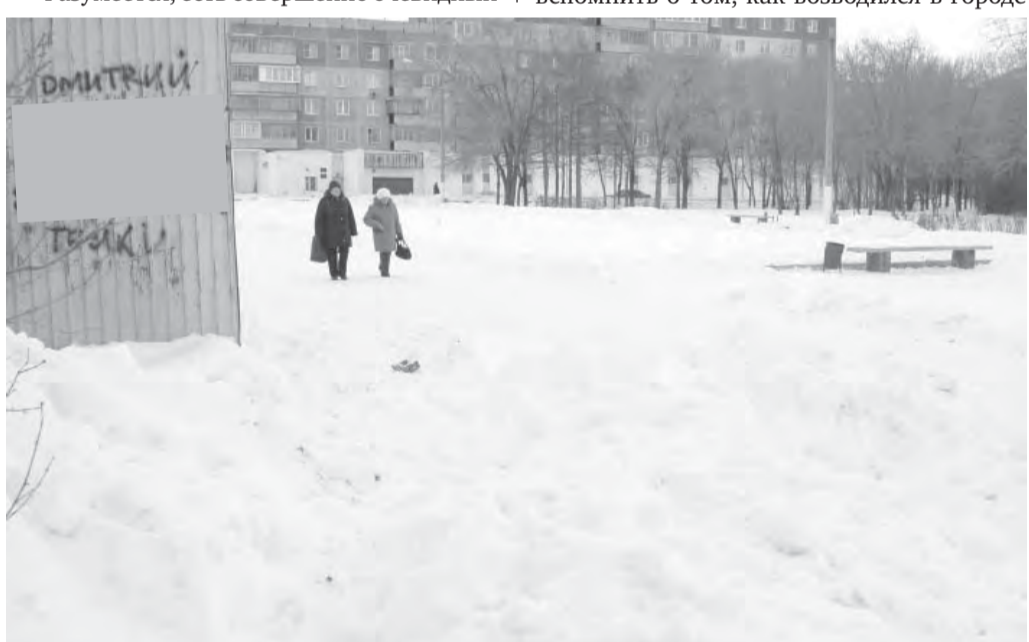
● Парк Трех поколений – не самое ухоженное место в городе.