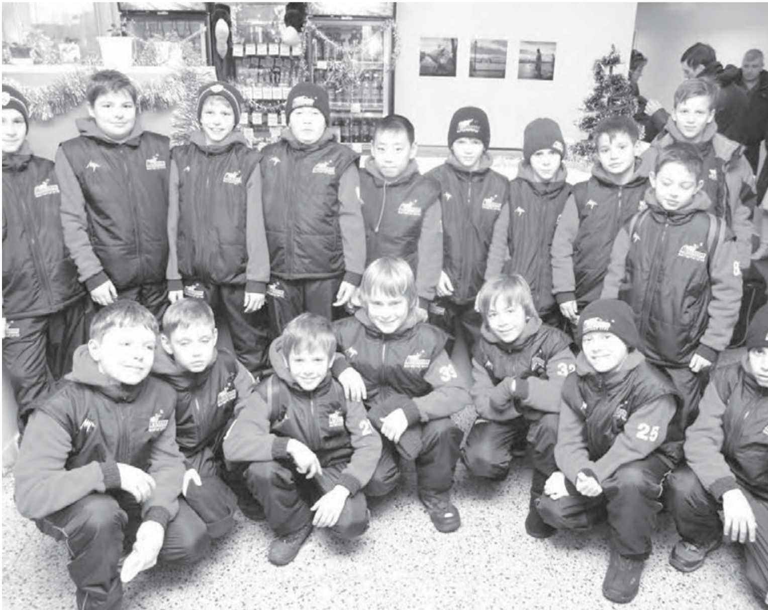
• Команда «Металлург-2000» летит на Рождественский кубок за океан.