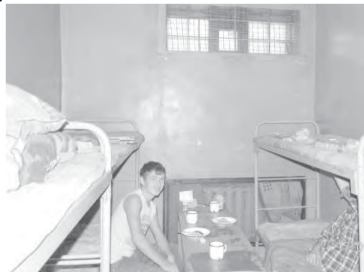
В камере спецприемника.

Что ожидает водителей, в отношении которых вынесен административный арест.