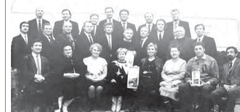
На этом фото вы найдете не одно знакомое лицо.

В один из его приездов в Магнитогорск состоялся знакомство с Никитиным. Город отмечал День металлурга. На одной из площадей шел концерт мужского вокального ансамбля «Металлург».