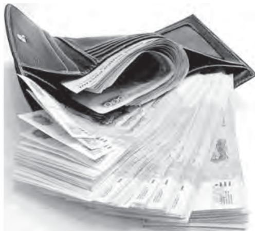
● Левый доход – помеха карьере.

После этого Дмитрий Медведев поручил Госналогслужбе и Генпрокуратуре в