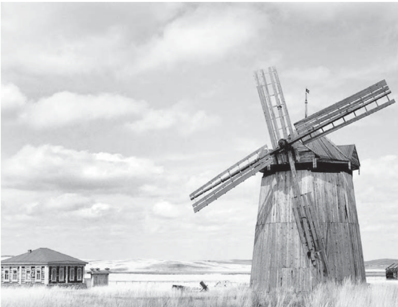
● Кусочек истории нашего региона отражен в Аркамле в музее под открытым небом.