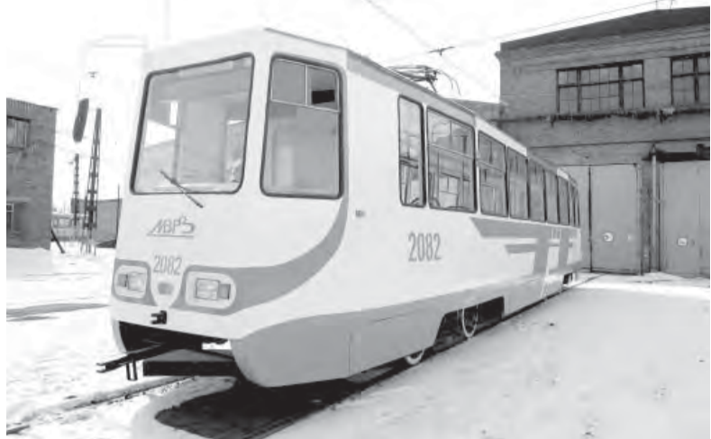
Бело-зеленый вагону к лицу.