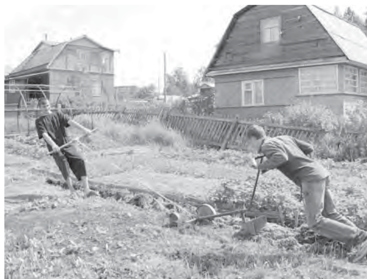
● А капать на чиновников не пробовали?

Оценка неучтенной недвижимости будет близка к инвентаризационной, продолжает