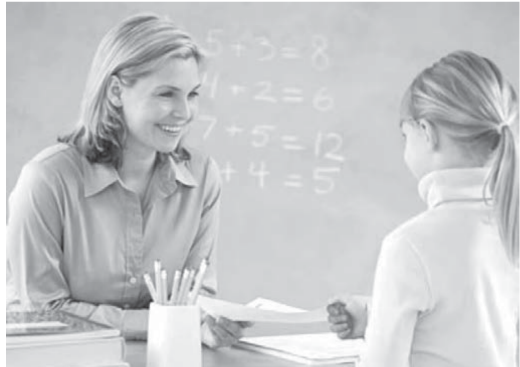
● У профессии учителя – женское лицо.

Абсолютным победителем городского конкурса «Учитель года-2011» будет назван победитель в номинации «Учитель школы».