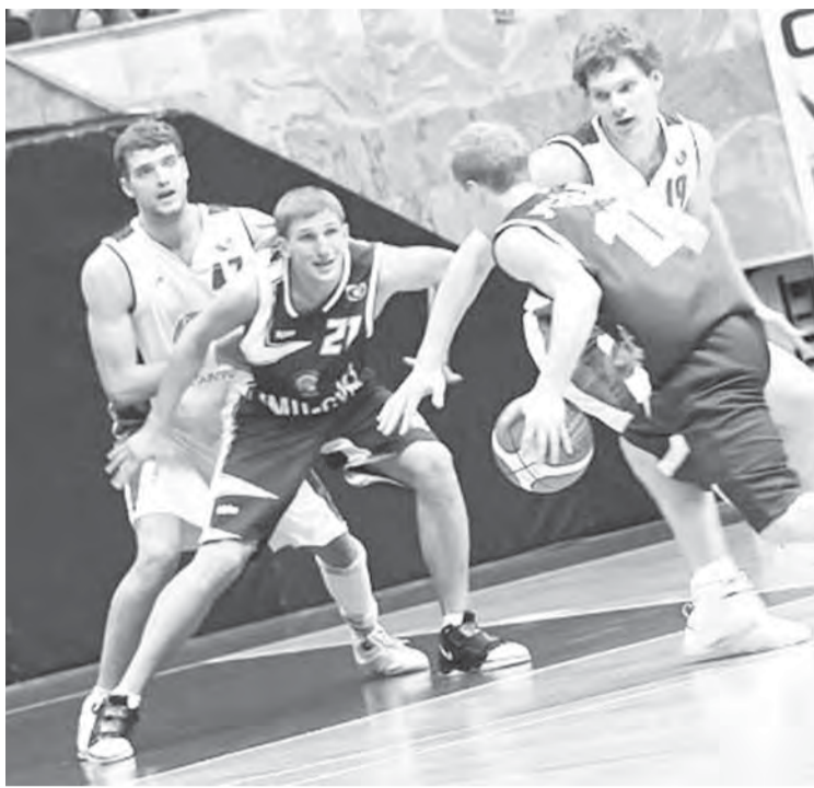
• Серия изобиловала острыми моментами.