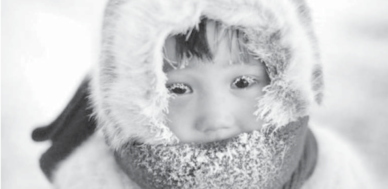
● Мороз не страшен, страшно не угадать с одеждой.