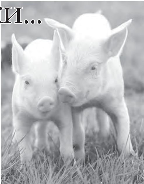
Отнюдь не каждый поросенок годен для отбивной...

Бельгия, где в 1999 году разразился скандал в связи с массовым заражением птицы диоксином, предложила ввести строгий надзор за разделением жиров, используемых для промышленного произ-