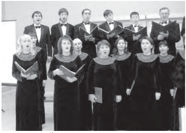
● Камерный хор Дома музыки.

Кто в этот раз не успел посмотреть это диво дивное, сможет открыть для себя таинство крещенских вечеров 27 января в стенах Магнитогорской картинной галереи.