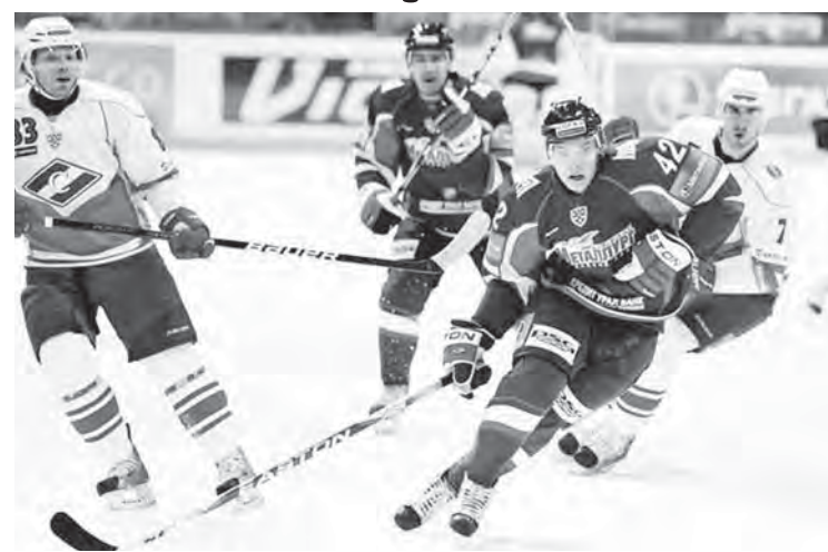
• Шайбу! Шайбу наконец!

«Я хочу поздравить «Спартак» с победой. Мы неплохо сегодня играли, но играли против хорошего вратаря, дважды попали в штангу. У нас, конечно, очень плотный график был, состоялась двенадцатая игра через день, а это тяжело. Ребята проявили характер и сыграли, как могли», – сказал наставник магнитогорцев Хейккиля после очередного поражения. Интересно, что Сергей Федоров дал совсем иной комментарий после поражения от «Спартака»: «Доминик всегда показывает свое мастерство и в каждой игре выдает пять-шесть вратарских шедевров. Мы же вообще не предложили Гашеку качественных моментов, поэтому и не забили».