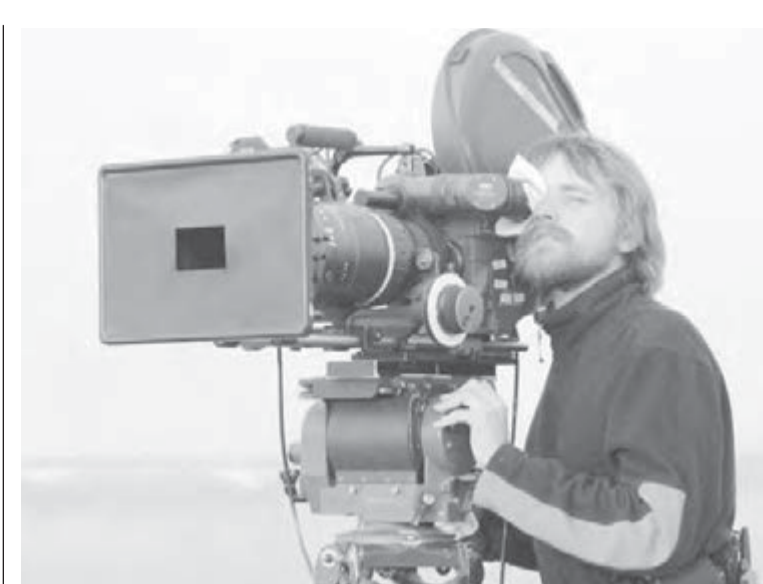
● «И кто яво знает, чаю он сымайт...».

Речь шла о мерах, нацеленных на формирование в стране стабильного, рентабельного кинорынка. «Мы с продюсером Сергеем Сельяновым выступили на тему о том, что в стране катастрофическая ситуация с кадрами, и в такой ситуации строить планы – утопия. Надо пытаться готовить множество киношкол по всей стране, а пока этого нет, индустрия развиваться вообще не будет», – сказал журналистам режиссер и продюсер Валерий Тодоровский. Компания «Рекум» Тодоровского вошла в число восьми лидеров российской кинопроизводства, которые получили на свои проекты средства из государственного Фонда социальной и экономической поддержки отечественной кинематографии, а его фильм «Стиляги» заслужил из средств Фонда бонус как проект, привлекая более миллиона зрителей.