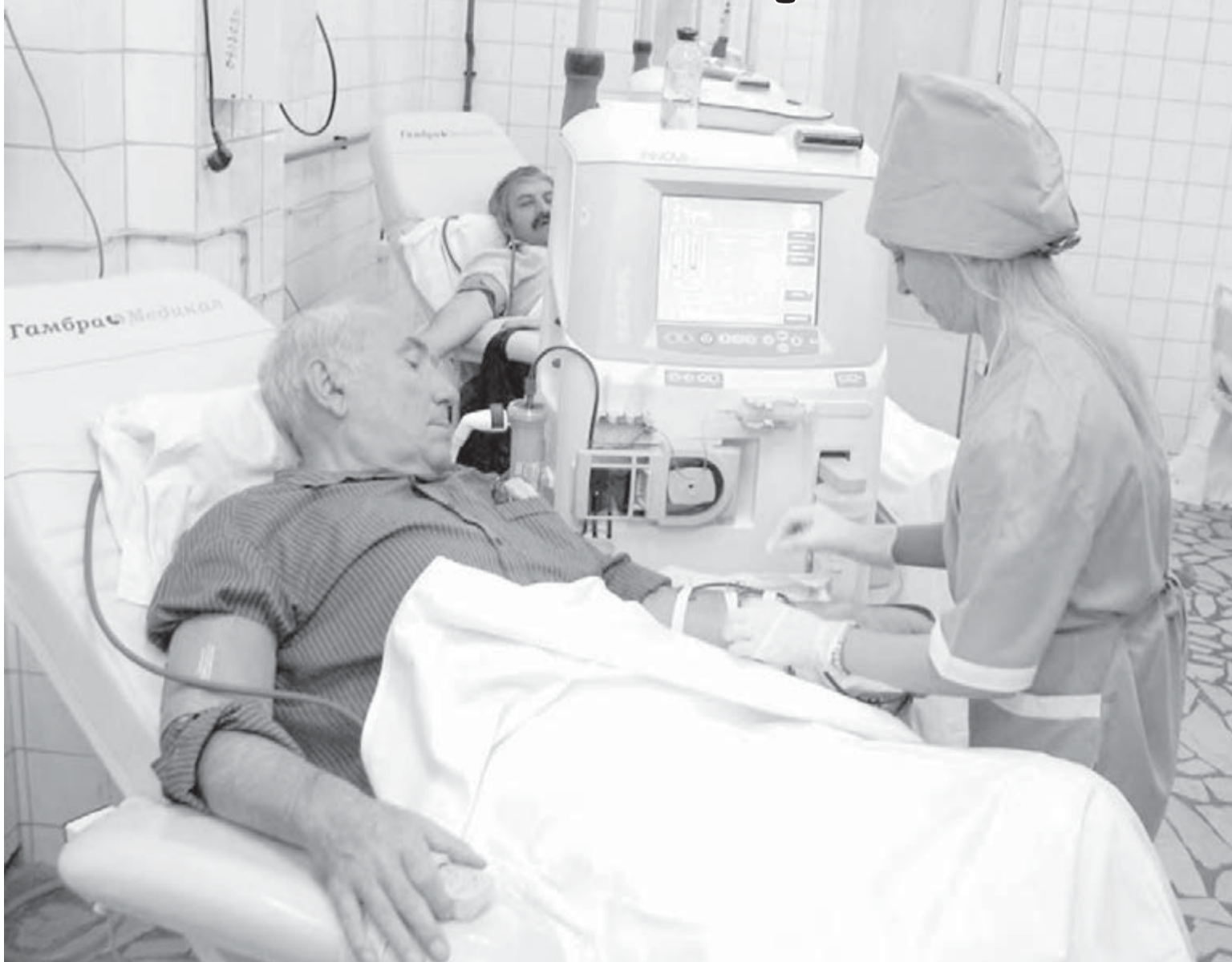
• Путь к здоровью населения лежит через высокие технологии.