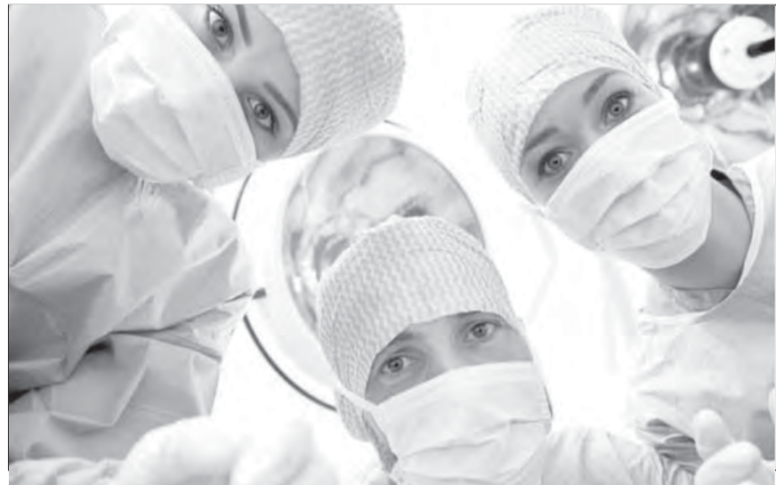
● Каждый из нас имеет право на равный доступ к врачам.

на то, что врачи, не поднимая головы, что-то пишут, вместо того чтобы уделить внимание больным. Внедрение современных информационных технологий позволит убрать ненужные бумаги.