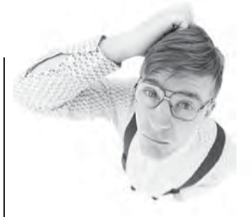
Ответы на задание в «МР» от 21 января:

10. Охотничий боеприпас, математический символ, стук барабана. Как назвать это одним словом?