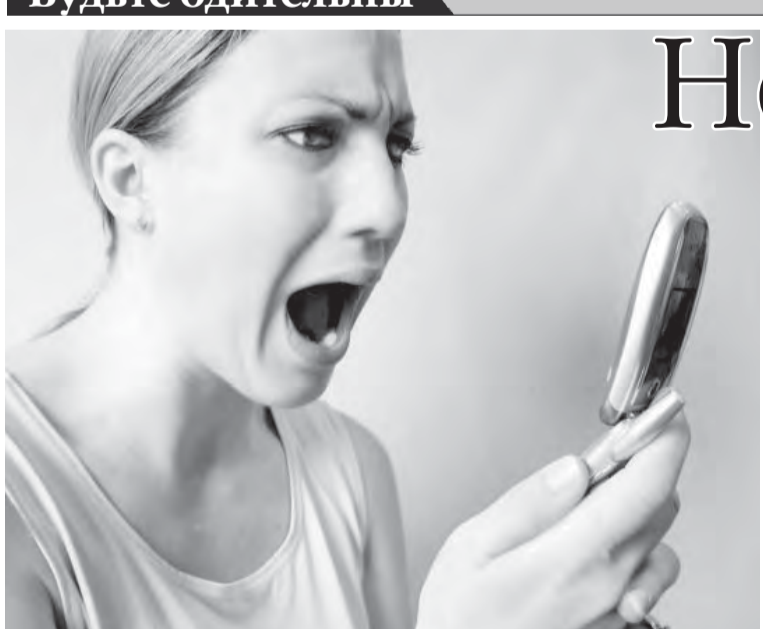
● Где деньги, Зин?

В зоне риска – человек с мобильным телефоном.