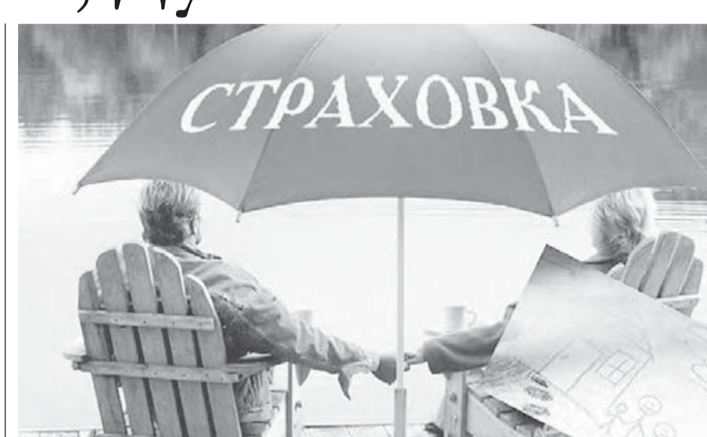
● Страховой зонтик нужен каждому больному.

Поликлинику каждый пациент сможет менять один раз в год. Как и страховую компанию – плательщика за медицинские услуги, которые больница оказывает паци-