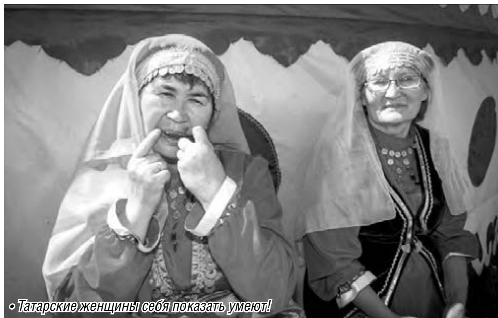
• Татарские женщины себя показать умеют!

Всех, кто желает принять участие в празднике, приглашают 12 марта в 15.00 в концертный зал Магнитогорского концертного объединения (Карла Маркса, 126). В программе конкурсы: «Визитная карточка», «Домашнее задание», во время которого участницы продемонстрируют национальное женское нагрудное украшение изю, из-