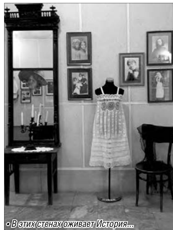
• В этих стенах оживает История...

Ценность «семейной» выставки в том, что изучение родословных позволит увидеть подлинную живую историю города и страны через судьбы отдельных семей и конкретных людей. Экспозиция будет интересна всем любителям истории и генеалогии. На ее базе в музее планируют проводить семинары, занятия и консультации для тех, кто составляет родословную своей семьи.