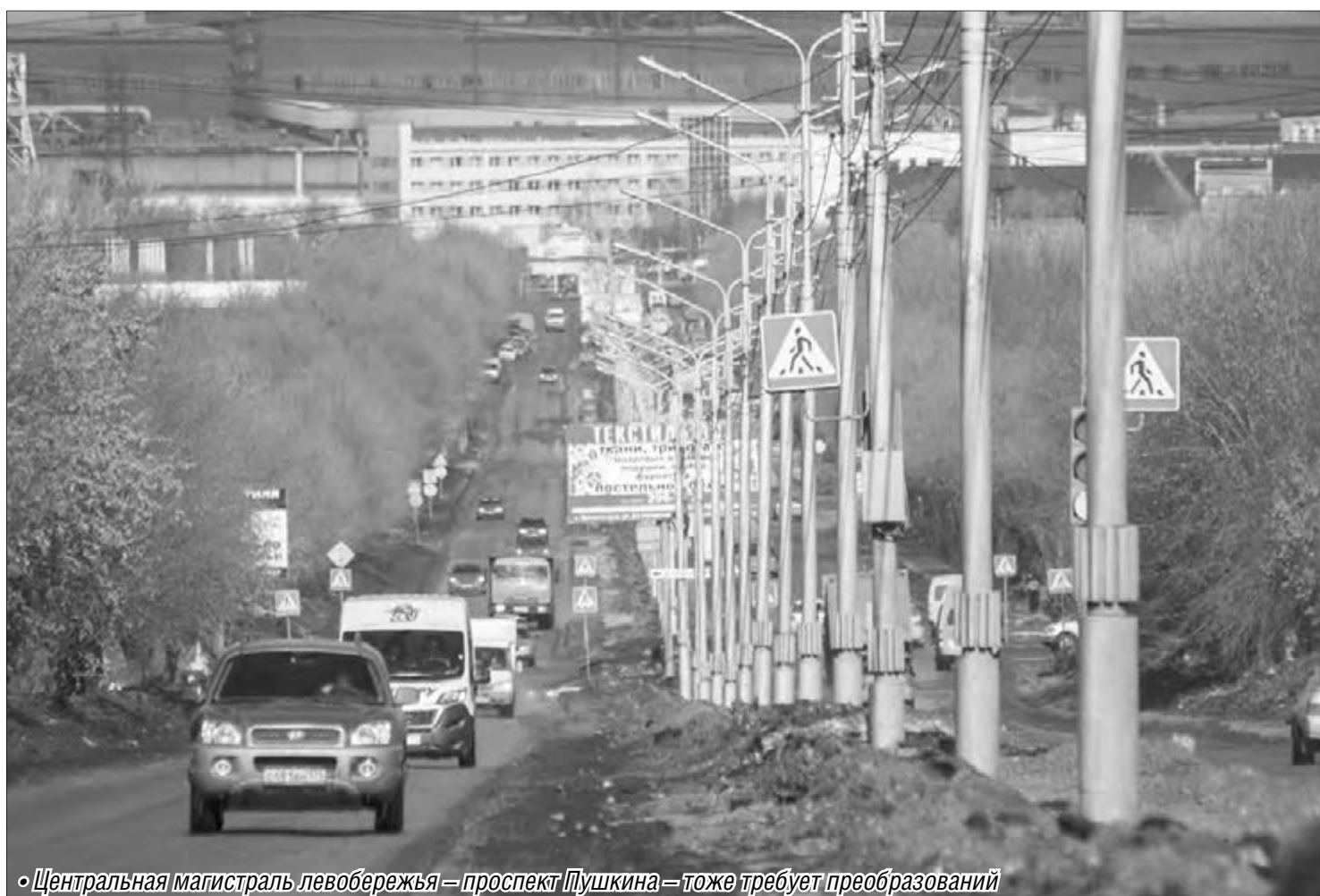
• Центральная магистраль левобережья – проспект Пушкина – тоже требует преобразований

Комфортный город начинается с тебя. Не останься в стороне